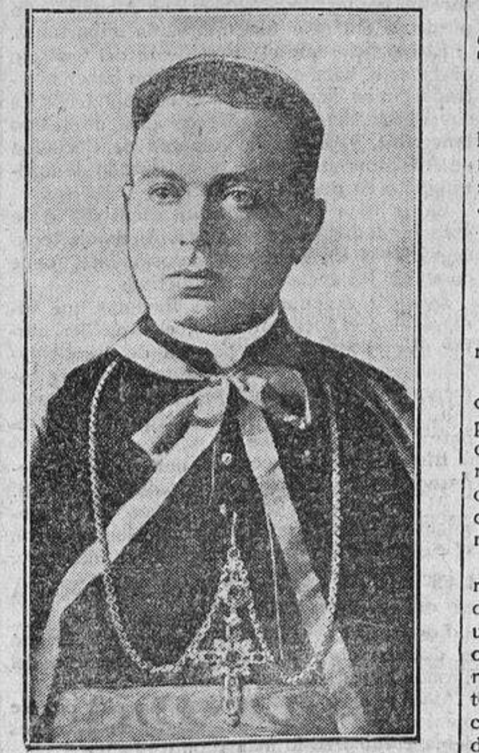
Monsiñor Tedeschini, nuncio de Su Santidad en Madrid, que lleva, en representación del Vaticano, las actuales negociaciones con el Gobierno español.

A preguntas de los periodistas, el jefe del Gabinete diplomático del ministerio de Est-