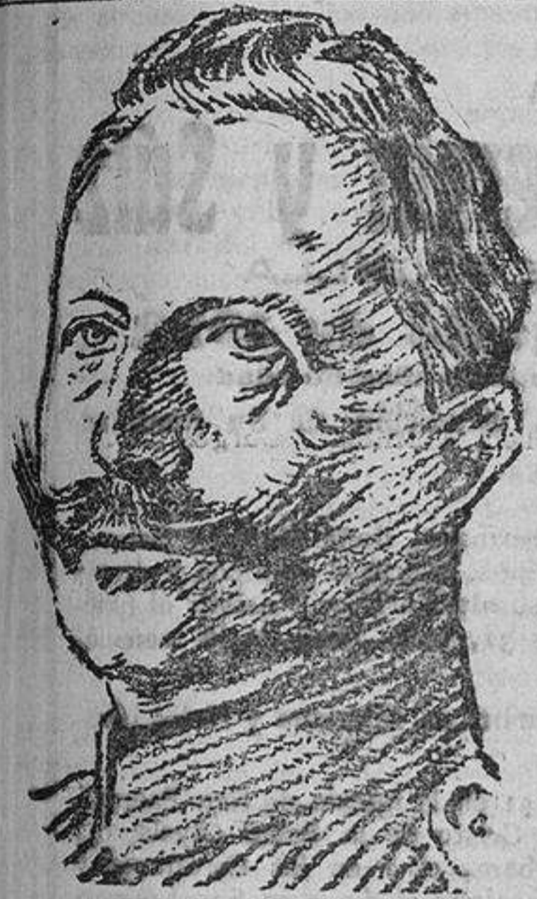
El Kaiser al estallar la guerra.

En los demás Estados mejicanos reina la más completa tranquilidad.