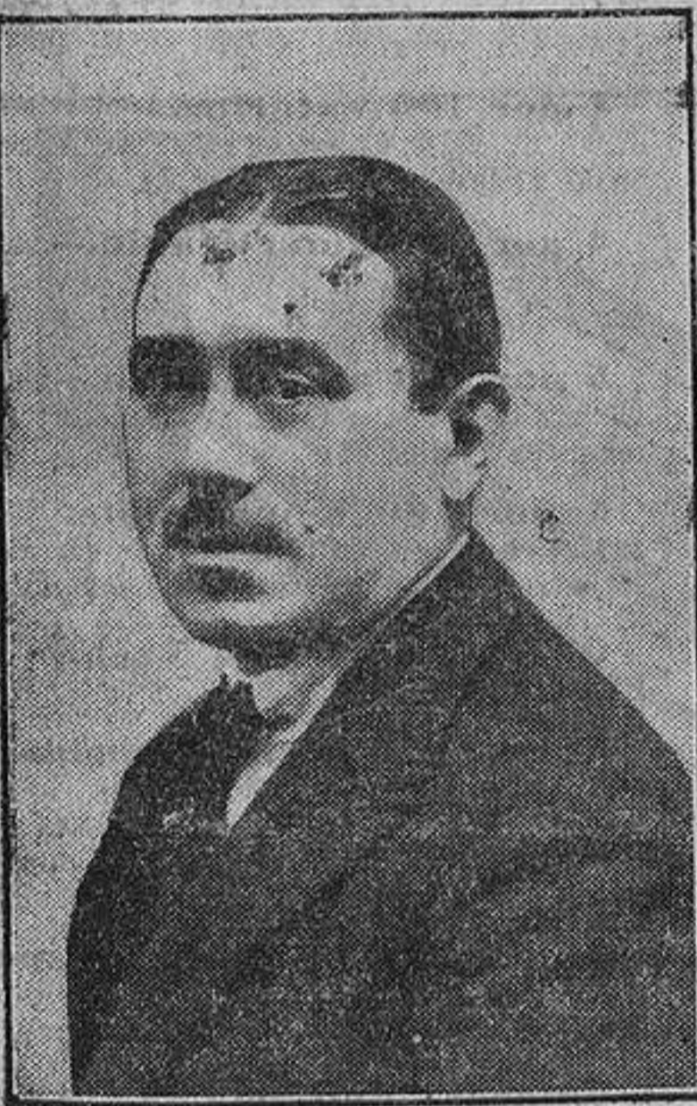
El maestro Turina, autor de la ópera «Jardín de Oriente», estrenada con gran éxito en el teatro Real.

Párecenos plausible el propósito de reprimir todo gasto superfluo y excesivo, mucho más si éste, siendo un gravamen para el contribuyente, no tiende a remediar cualquiera de las muchas necesidades sentidas por el país; ahora, que el señor Pedregal tiene que poner tiento en el desmoche, para que éste sea lógico, equitativo y fructífero. Capítulos hay, como el de Marruecos, donde toda energía puesta al servicio de una reducción de gastos será acogida favorablemente por la opinión, que ha de ver en ello como la iniciación de un protectorado civil no se limita tan sólo al envío de un alto comisario que no lleva estrellas en la bocamanga. Ahonde en este sentido el Sr. Pedregal, y con ello, cuando llegue la hora de presentarse en el Parlamento con un presupuesto que responda enteramente a sus convicciones económicas, ya llevará por adelantado la confianza de la opinión, que hoy más que nunca ansía que los millones dedicados a Marruecos no den motivo a nuevas pruebas de sangrientas ineficacias, cuando no a escandalosos «affaires», que demuestran hasta dónde llega la desaprensión y la esterilidad del esfuerzo económico del país.