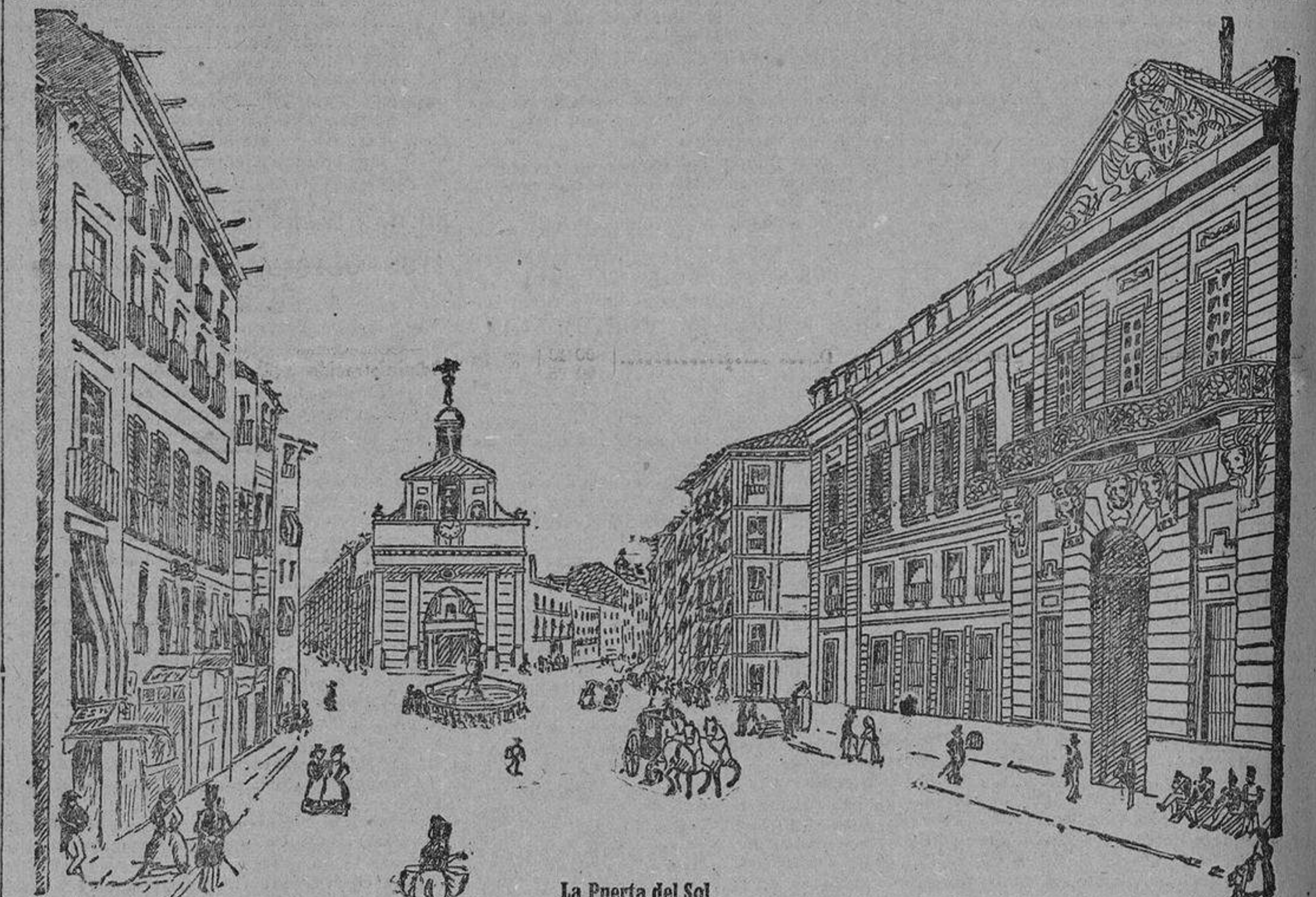
La Puerta del Sol en 1840

labradas en los vanos de los tres picos, rematando el todo con una cornisa general, en la que sienta un antepecho, que encubre el tejado. La fachada del Mediodía, semejante en altura y número de huecos a las referidas, se diferencía de éstas en que toda es de agramilado.