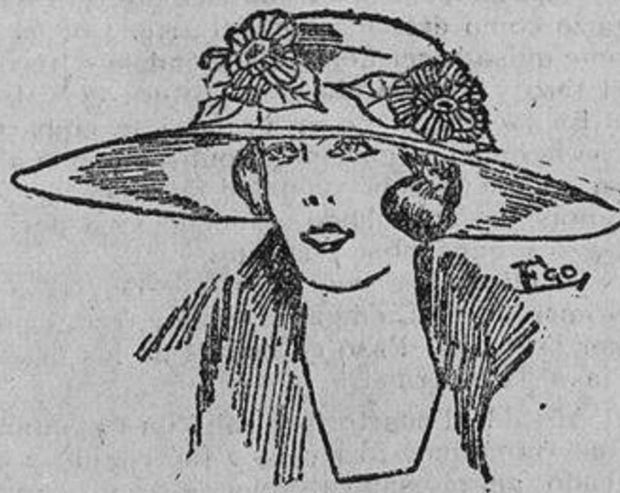
Sombrero de fieltro color gris, adornado con flores y hojas del mismo color. La copa y el ala completamente lisas. El ala forrada de terciopelo negro.

Desde 1896 que el venerable doctor D. Federico Rubio creó la primera Escuela de enfermeras, bajo la advocación de Santa Isabel de Hungría, hasta el 22 de febrero de 1917,