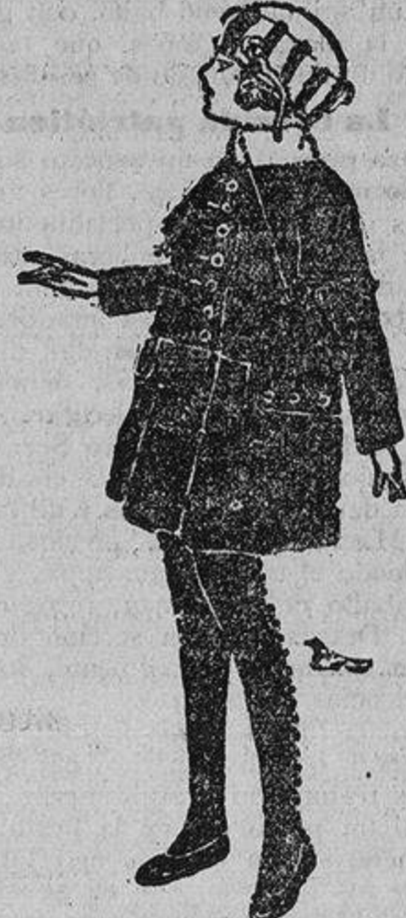
MODELO NUMERO 2

Recientemente se ha celebrado en París una importante almoneda, y así como los objetos de arte, joyas, cuadros, etc., se vendieron casi al mismo precio de la tasación, los muebles, por el contrario, adquirieron precios elevadísimos. El famoso busto de Cagliostro, de Houdon, que había sido tasado en 60.000 francos, sólo fué pujado a 47.000, y en cambio, el mobiliario de un salón de la época de Luis XVI, decorado con animales y pájaros sobre fondo amarillo, fué vendido en 147.500