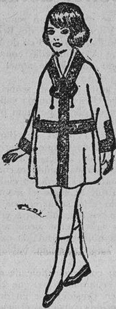
MODELO NUMERO 1