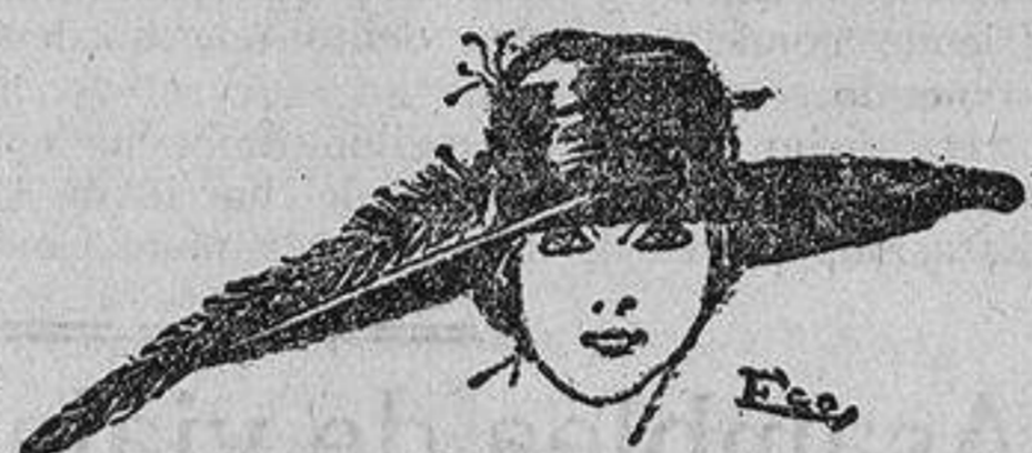
Sombrero en gamuza color cuero y pluma del mismo color. La copa lisa y el ala muy aucha.

Mademoiselle Margarita Sylva opina lo siguiente: Quince minutos para el baño; diez para ponerse el corsé y la ropa interior; quince