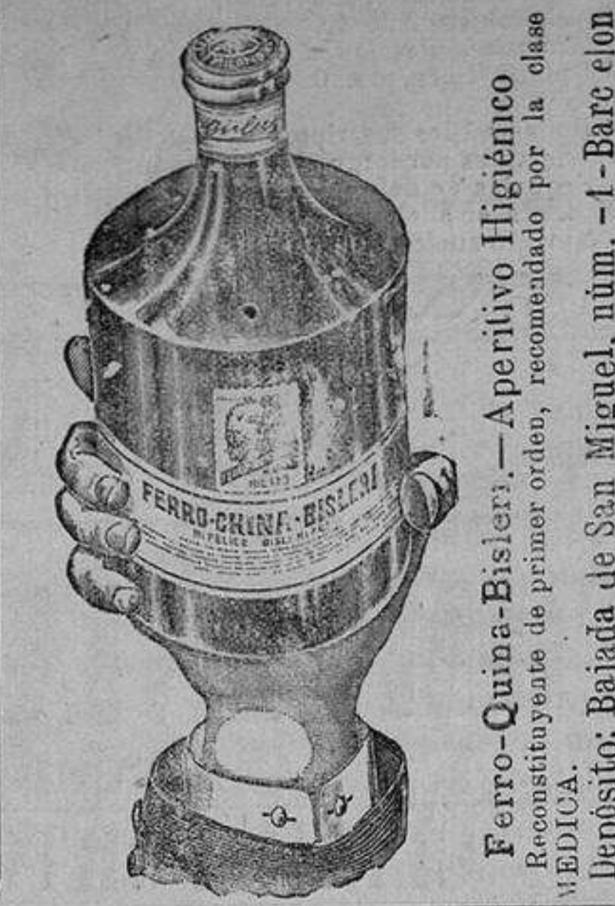
Ferro-Quina-Bisleri. — Aperitivo Higiénico Reconstituyente de primer orden, recomendado por la clase MÉDICA. Depósito: Bajada de San Miguel, núm. 1 - Barc elon