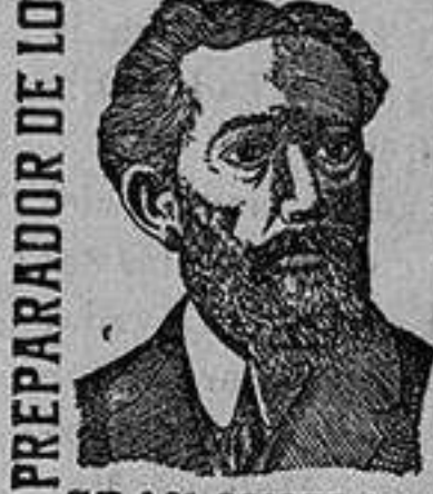
PREPARADOR DE LOS MEDICAMENTOS GRAU YNGLADA