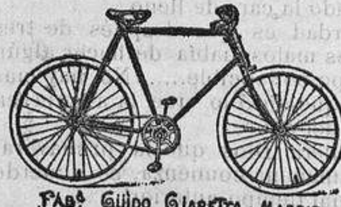
FAB. GÜIDO GIARETTA MADRID.

PREMIADO CON 40 MEDALLAS Venta en los establecimientos ultramarinos de España. Oficinas.—PALMA ALTA, 8. Depósito Central.—MONTEA, 25