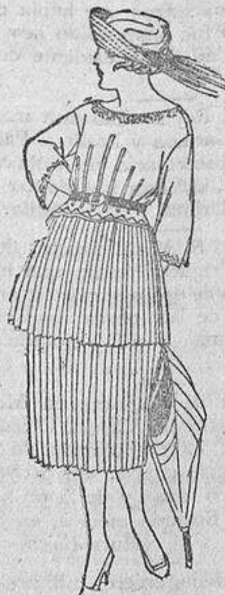
Vestidos de lanilla, estambre, etc., plisados y adornos bordados. De ptas. 120 a 140.