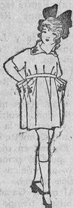
Vestidos de estambre, lanilla, etc., adornos bordados, para niñas de cuatro a nueve años. De ptas. 38 a 48.