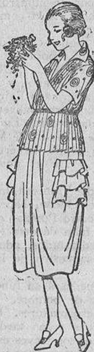
Blusas de volle estampado, diferentes dibujos. De ptas. 18 a 25. Faldas de sarga inglesa, estambre, etc., en negro, azul y color. De ptas. 48 a 55.