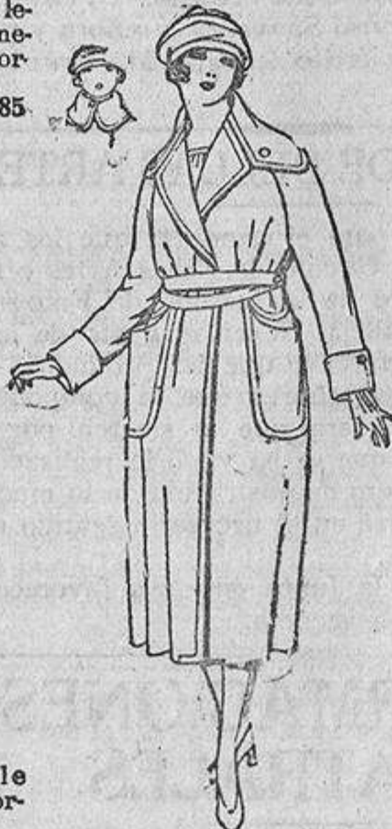
Guardapolvos de dril, gabardina, alpaca, etcétera, diferentes colores. De ptas. 30 a 65. Los mismos en seda cruda. De ptas. 60 a 70.