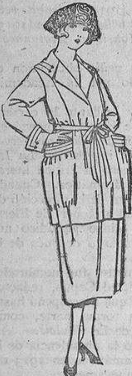
Trajes de gabardina, lanilla, estambre, etc., en negro, azul y color, pespuntes de adorno. De ptas. 135 a 160.