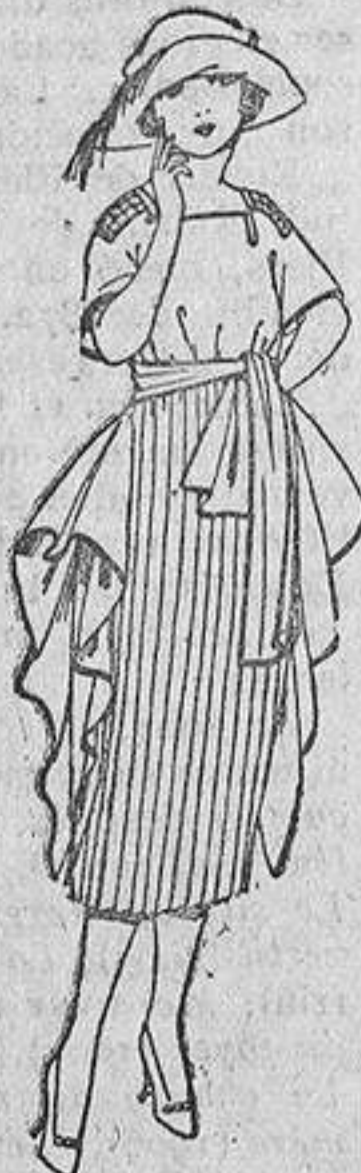
Vestidos de etamín blanco, azul y color. De ptas. 60 a 72.