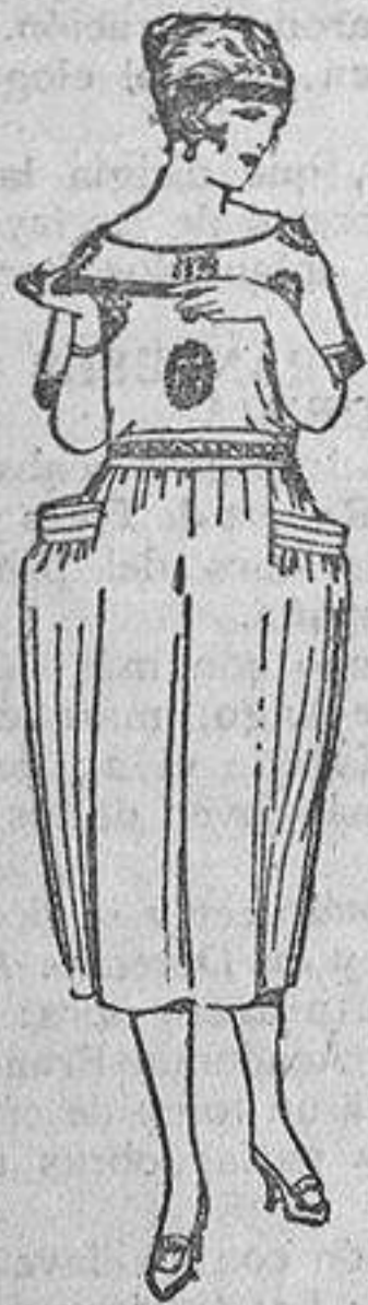
Blusas de crepón de seda, pongée, etc.; adornos bordados. De ptas. 38 a 60. Faldas lanilla, gabardina, etc., en negro, azul y color. De ptas. 45 a 50.

Barcelona, Alicante, Almería, Bilbao, Cádiz, Cartagena, Gijón, Granada, Málaga, Palma de Mallorca, Santander, Sevilla, Valladolid, Valencia, Zaragoza