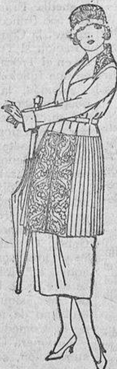
Trejes de sarga inglesa, estambre, etc., en negro, azul y color, adornos bordados. De ptas. 190 a 185.