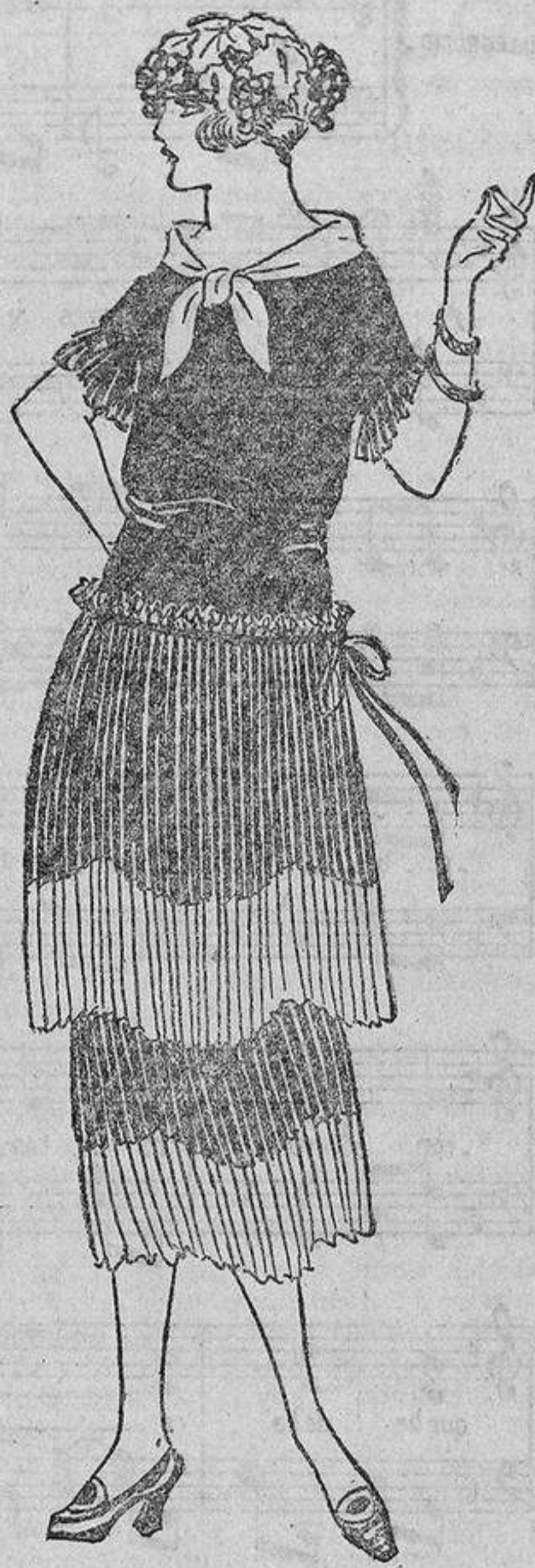
¿Algo nuevo y original para una elegante? Desde luego este vestido de «fouard» marino, con unos grandes ojales por entre los cuales se apercebe el vestido interior de organdí blanco.