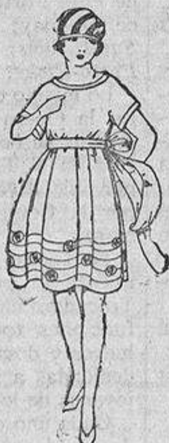
Vestidos de volle blanco y colores, adornos bordados. De ptas. 45 a 58.