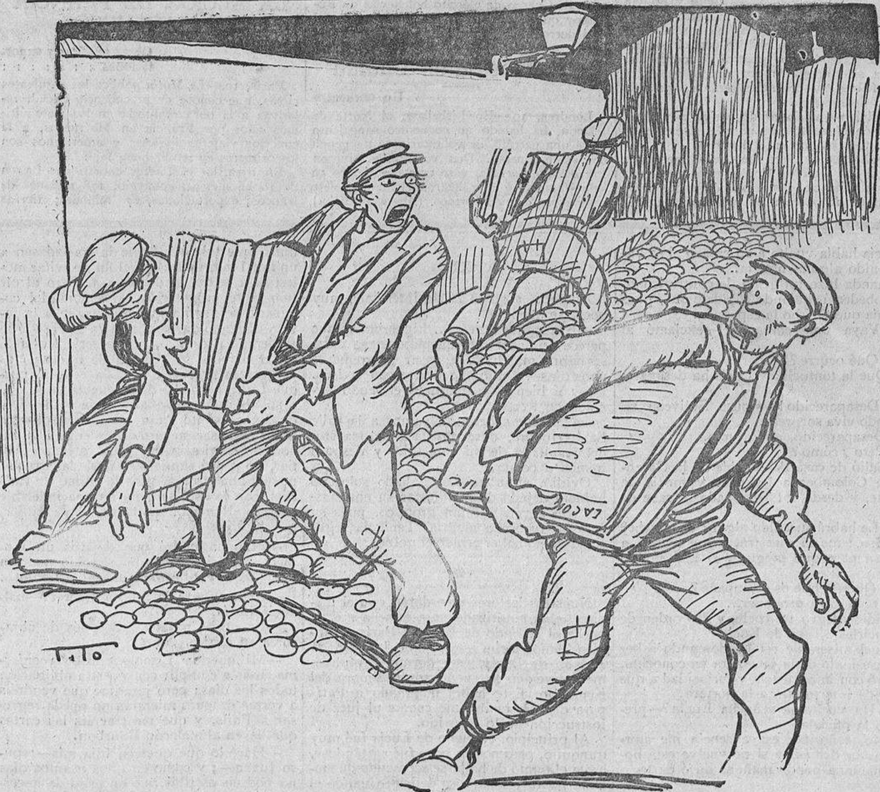
¡Espera, que el manco ha perdido una mano!...