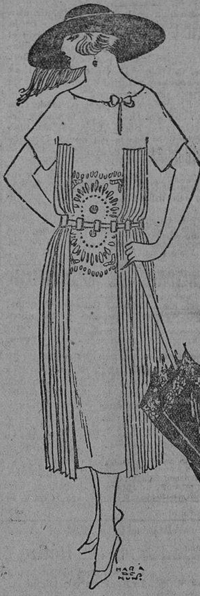
En tussor blanco, con bordados blancos o amarillos; y cintura plegada en terciopelo amarillo.