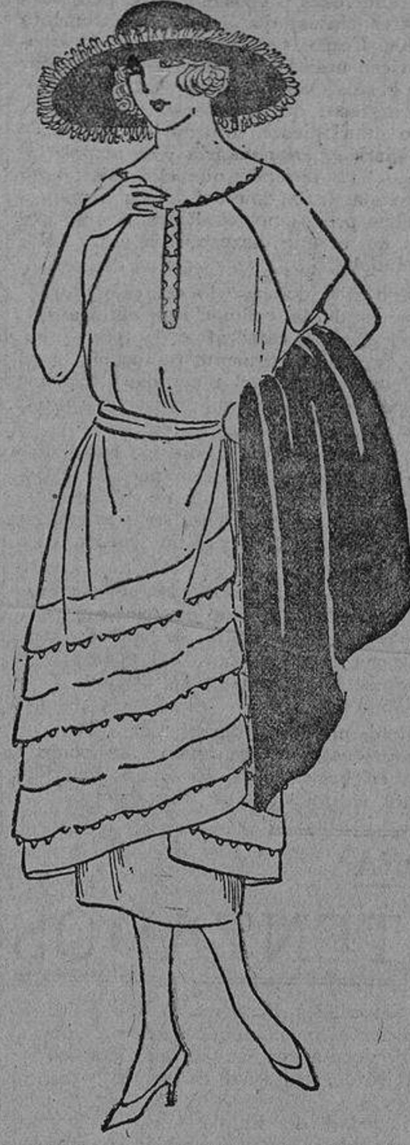
En tela de hilo con tres loras ribeteadas con pliques; movimiento ligeramente recogido a un lado.

gusano de la mentira y de la felonía se instala para roer el fruto del matrimonio. En oposición, traduciré esta otra: «Aunque provinciano, opino que un marido no debe abrir las cartas de su mujer, así como la mujer tampoco tiene el derecho, etc. La mujer más honrada del mundo puede tener algún secreto, aunque no sea más que el de una amiga que se lo confía.»