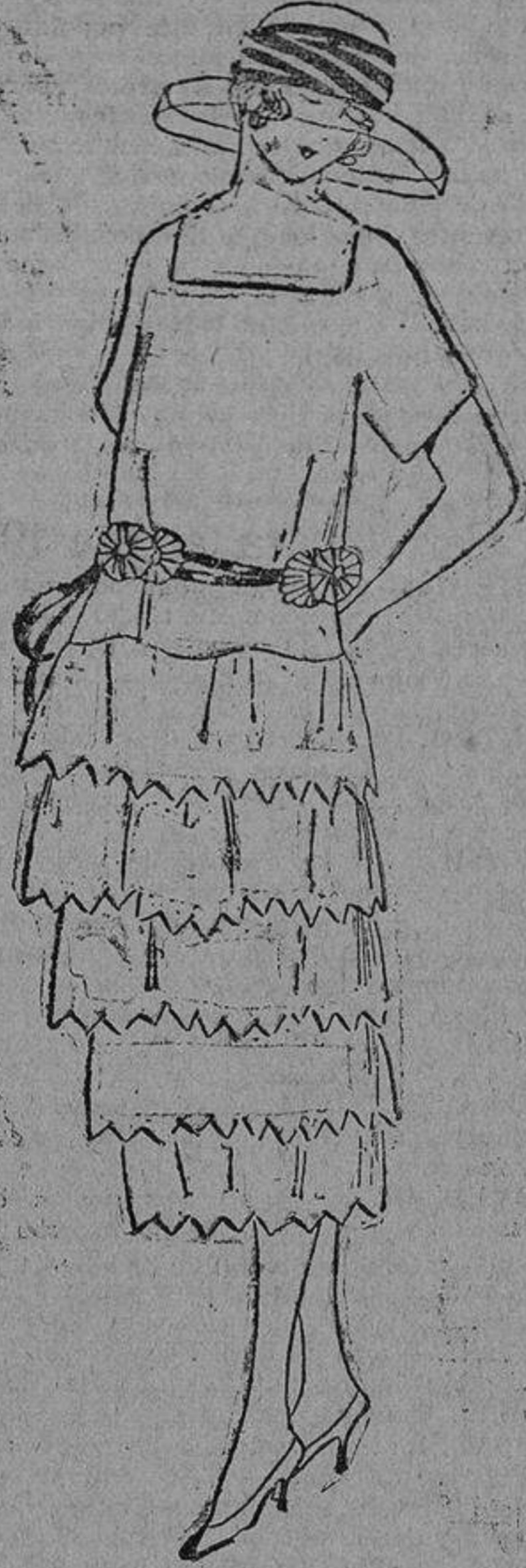
En lino rosa, con festones blancos; cintura de terciopelo azul porcelana.

«Si mi mujer se niega a que abra su correspondencia, quiere decir que me oculta algo, una falta seguramente. El día en que una mujer tiene algo que ocultar, el