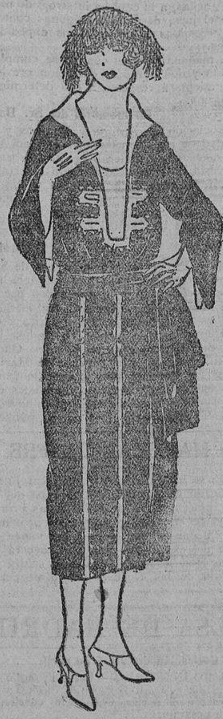
De crepón negro con bordados de tonos viejos hechos con abalorios. Cuello de seda blanca.