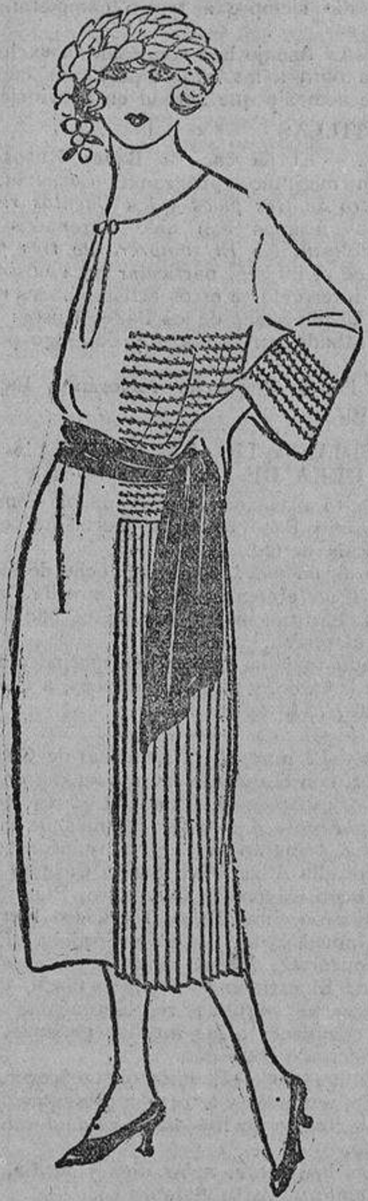
Sarga marino, lados plisados y bordado rojo y negro en líneas horizontales.