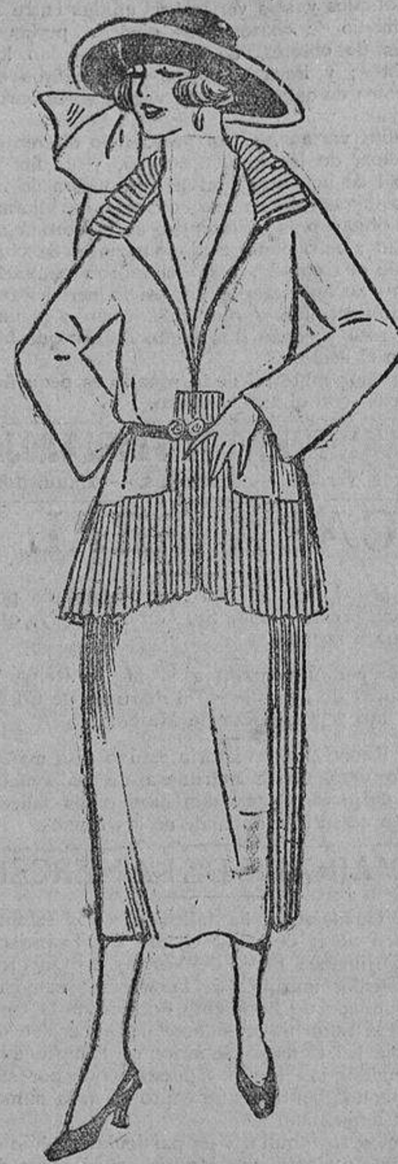
Juvenil traje sastre de gabardina delgada, «beige», con volante plisado.

cebo, la coquetería la caña, los hombres los peces, la madre el pescador y el marido el pescado.