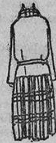
Como están bastante en boga los tejidos escoceses, este vestido tiene la falda así, «beige» estampada en azul marino y enteramente plisada; el cuerpo, de tejido «beige» liso, tiene dos bolsillos debajo de la cintura.

es una de las bases de la moral y es también la base de la elegancia. Sed autocríticas de vuestra belleza, consultando fríamente un espejo «que no favorezca demasiado», y después de un examen concienzudo, elegid bien lo que más pueda hacer resaltar vuestros encantos, escoged atentamente entre los modelos que seguirá publicando este diario aquello que, si sois bellas, aureole mejor vuestras dotes, y si sois regulares (feas no podéis serlo, porque no hay mujer que no tenga algún rasgo de atracción o de belleza), realce lo que tengáis de más bello, idealice el conjunto, procurando así una nueva belleza, pues es sabido que existen dos: una, la que se posee, y otra, la que se adquiere; y este axioma puede aplicarse lo mismo a una cara linda como a una silueta seductora.