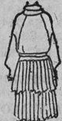
Este vestido se ha permitido la fantasía de tener un corte en su cuerpo blusón, poco frecuente en vestidos de niñas; es una especie de manga ranglán con costura que desciende bastante del hombro; el traje azul marino tiene dos volantes plisados y un pecherito de tafetán blanco con cuello vuelto.