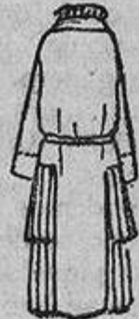
Muchas mamás resolverán el problema de hacer un vestido sencillo y elegante para sus niñas si copian este acertado modelo. Los volantes colocados solamente a los lados, dejan el delantero y la espalda lisos; así su gentil dueña no tendrá nunca el vestido arrugado.