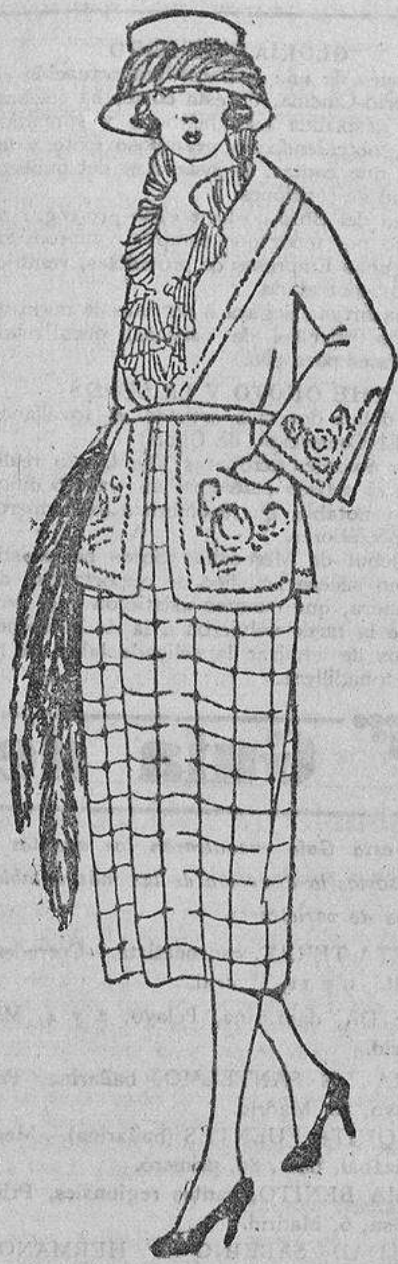
El «chico» está reconcentrado en este vestido de franela o de «tussor» crudo con cuadros rojos para la falda, y liso, pero bordado en rojo, forma la chaqueta.

—¡Qué quieres, rica mía? No tardó en darse cuenta de que en la