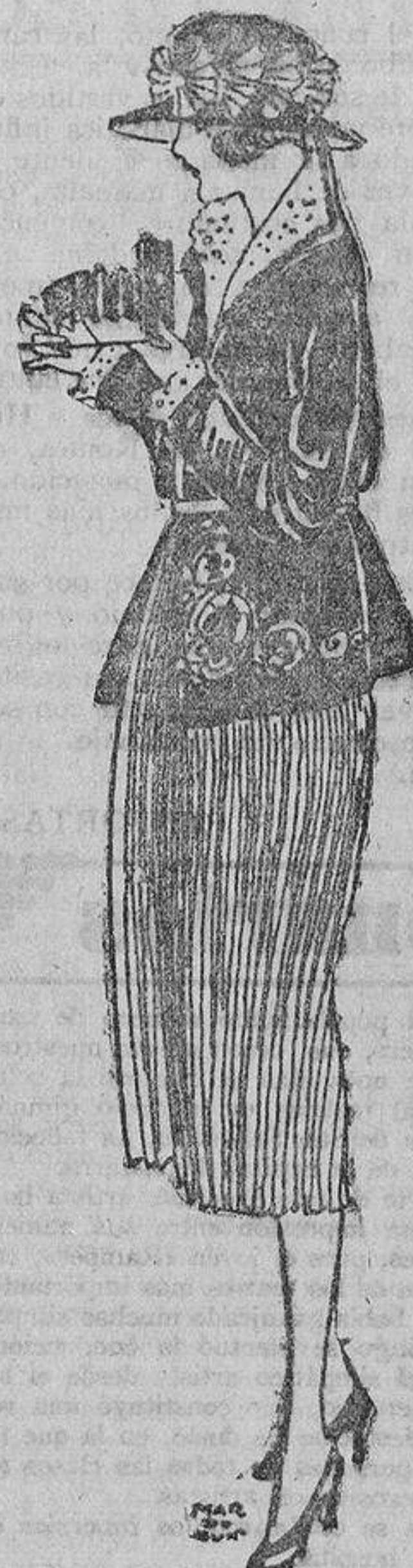
Ella es la que merece ser retratada, con su falda blanca plisada y su chaqueta de tafetán azul marino, bordada en blanco.

casa no había más voluntad que la suya, que todos se doblegaban ante sus caprichos, y si alguien decía que la mimaban demasiado, los padres contestaban felices y sonrientes: