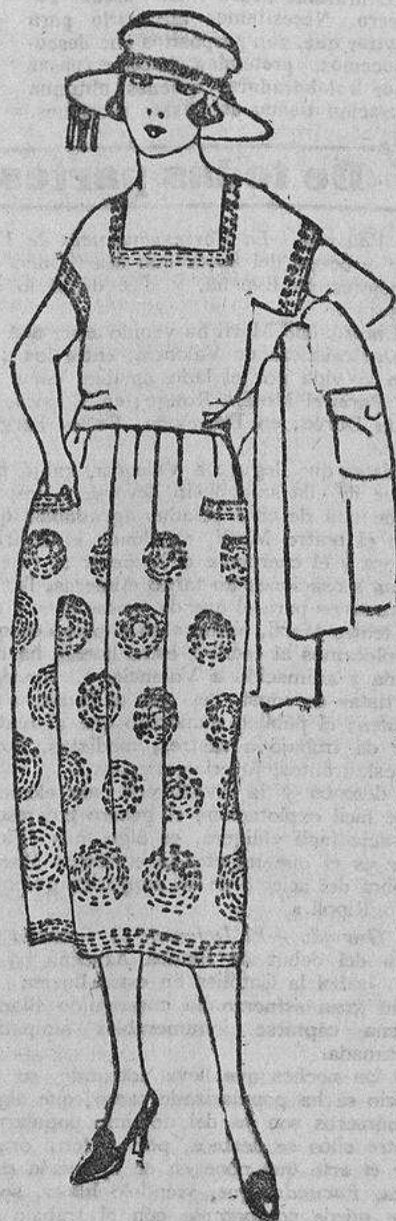
Aquí donde lo ves, que parece un modelo, está hecho en casa gracias a su habilidosa tía, que ha bordado unos gruesos pespuntes verde claro sobre el fondo blanco de la tela.