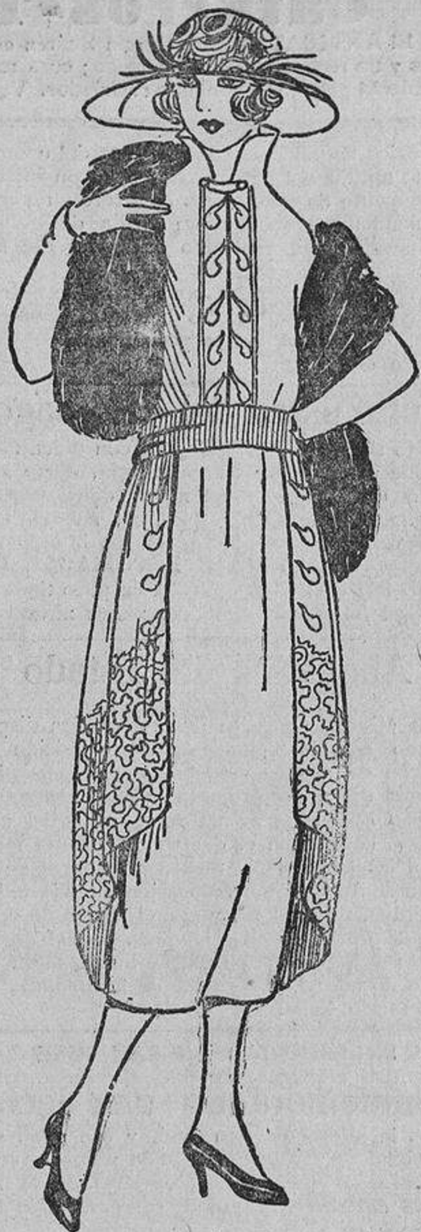
El vestido, de duvetina verde oscuro; la sobrefalda, corta delante y bordada con «soutache» negro.

He conocido una mujer, enamorada del esclavo de «Cabiria»; cuando vió la película y recibió el flechazo, hacía tres años que el actor había fallecido. Cuando se enteró, se avergonzó de su corazón; pero yo no he encontrado eso «tan ridículo», porque el amor, como el cine, no es más que una teoría de fantasmas deliciosos; los unos y los otros no son ¡ay! más que puras ilusiones.