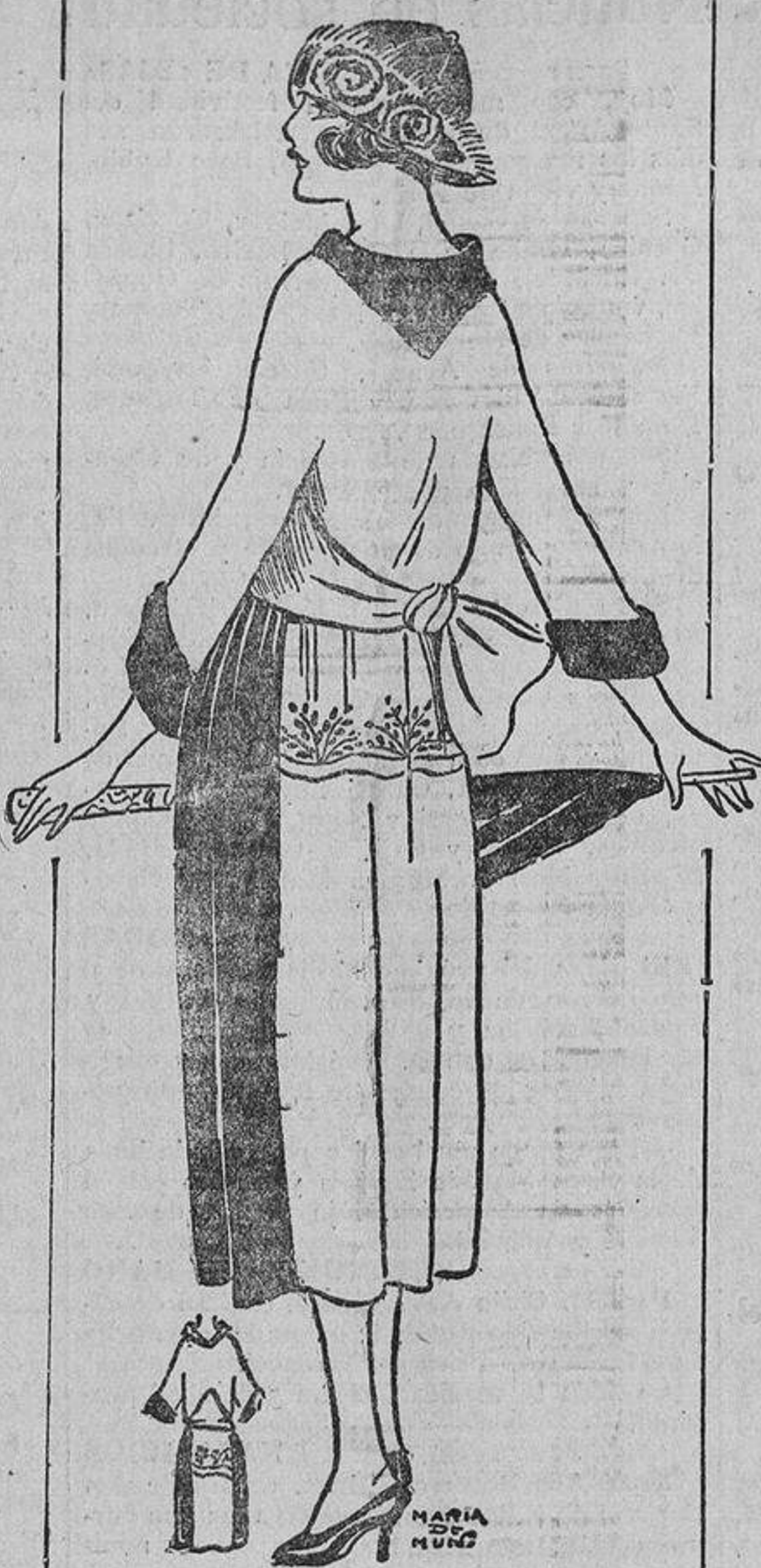
Terciopelo de lana gris, combinado con crepón de China, azul miosotis.