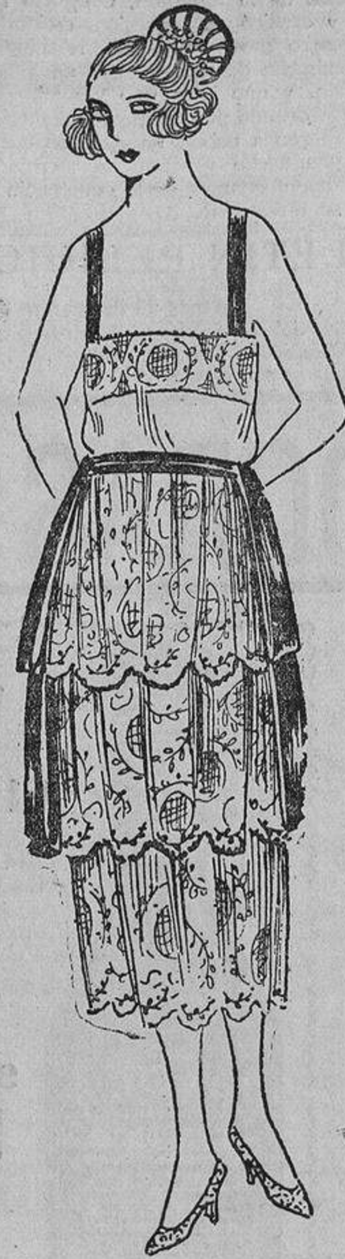
¿En este modelo creeréis, así como yo, ver un traje de baile? Nada de eso; se trata sencillamente de una combinación compuesta por tres volantes de encaje crema, que forma parte de un «trousseau» elegante.

pequeñas, hasta demasiado pequeñas, ¿por qué las cargan con sortijas? Las sortijas no sirven más que para disimular defectos.