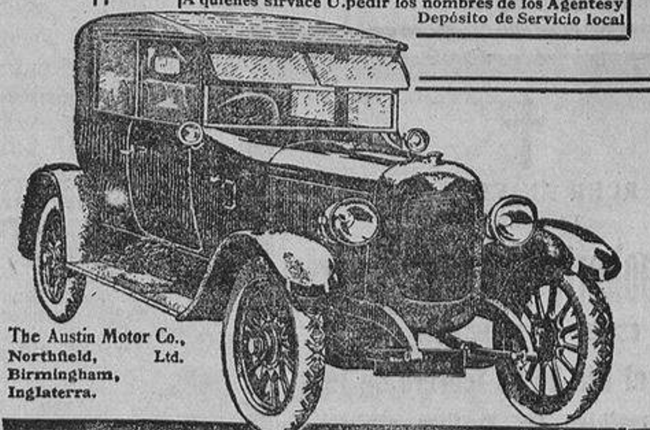
The Austin Motor Co., Northfield, Birmingham, Inglaterra.

A quienes sírvase U. pedir los nombres de los Agentes y Depósito de Servicio local