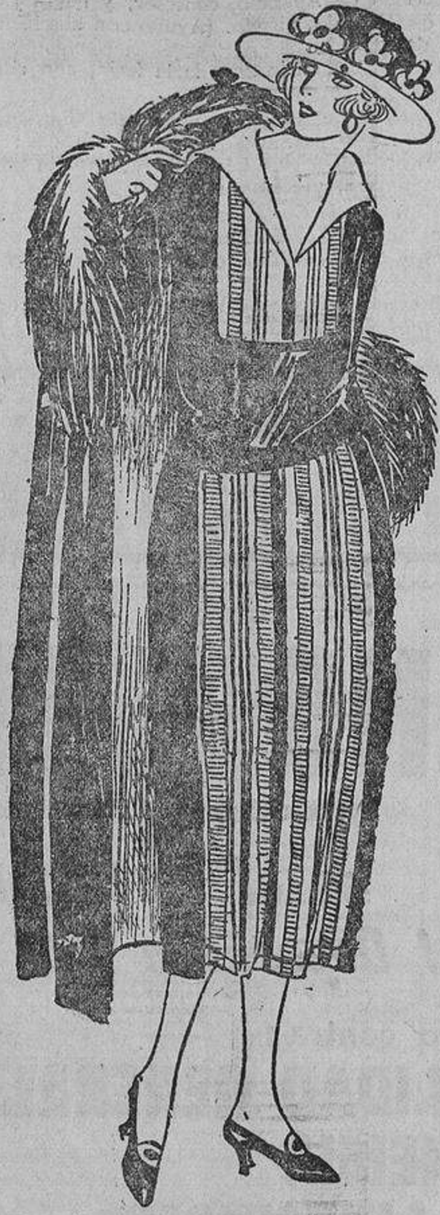
Como el anterior, este traje se combina con dos tejidos en azul marino, pero liso el del cuerpo y costados y rayado en colores el pecho y delantal.