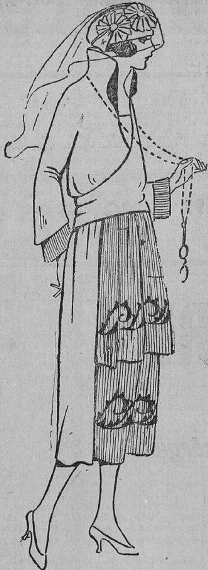
De «charmense» azul marino, con dos volantes de crepón «georgette» bordados en azul «nattier»; cuerpo cruzado que se anuda en la espalda.