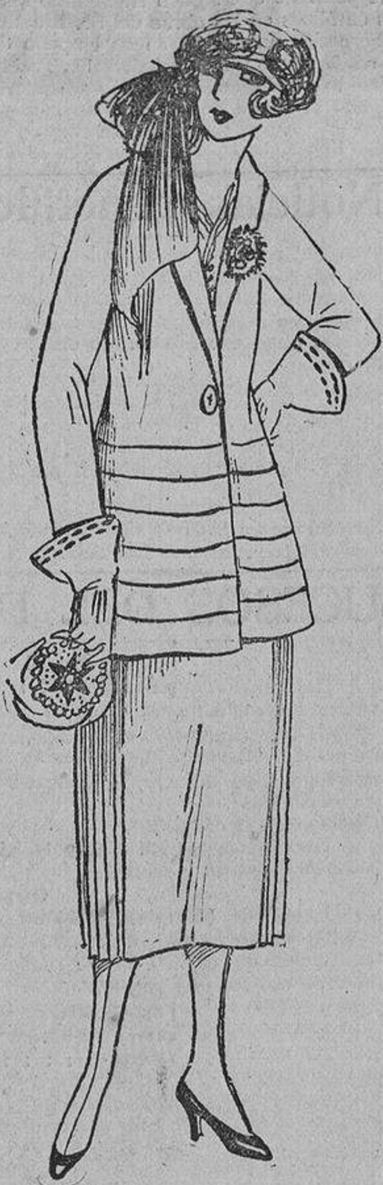
Un sencillo traje sastre con la novedad de unos plieguitos menudos que nacen desde la cadera; falda con plisados en los costados.

Una novela influyó tanto en mí cuando tenía ocho años, que sugestioné a una amiga para que fuésemos a las ferias y nos robasen unos titiriteros. Así lo hicimos; del colegio nos marchamos a las ferias que se celebraban cerca, en la misma pobla-