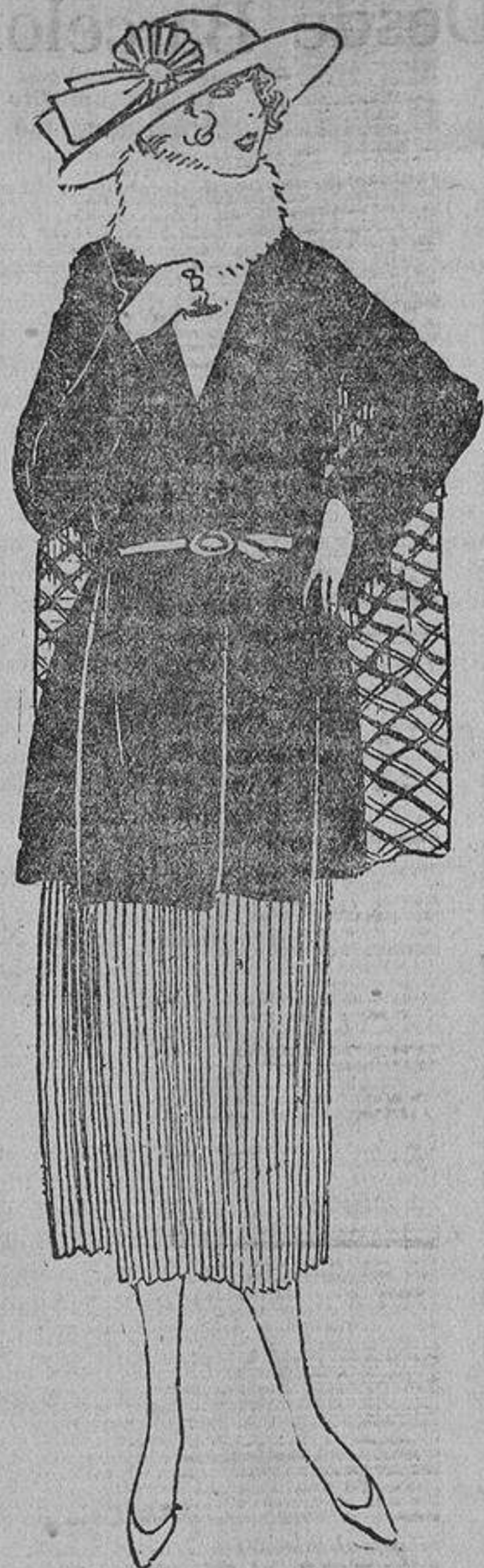
Trajecito fantasía; cinturón pasado en los costados por jarra francesa; la capita nace en los hombros.