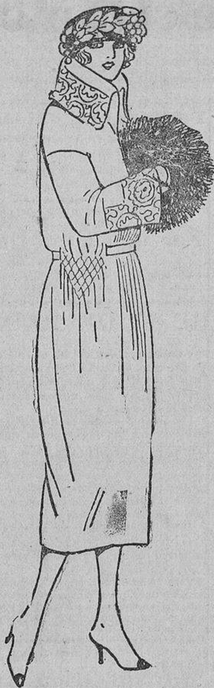
En los abrigos, los frunces «nido de abeja» se colocan a menudo en forma de triángulo, como en este abrigo de terciopelo de lana color arena.

En cuanto al capítulo de los sombreros, es de notar el incremento de las formas grandes, abandonadas desde hace algunos años.