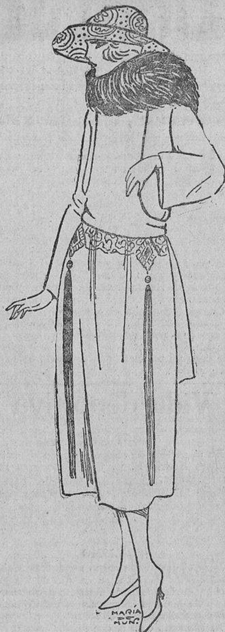
Una bonita idea la de ese bordado negro, del cual caen delante y detrás unos larguísima borlonas de fleco.

Apenas existe el término medio: o grandes o muy chicos, en forma de tocas, cubiertas de flores, veladas por un tul que rodea la forma y cae a un lado, formando un gracioso lazo. Estas formitas, con graciosa «caída», sea de cinta, de tul o de tela flexible, tendrán y tienen un éxito inmenso, porque favorecen a la mayoría, dando ese aire añejado, que con la ayuda y complicidad de las patillas rizadas, buscamos todas.