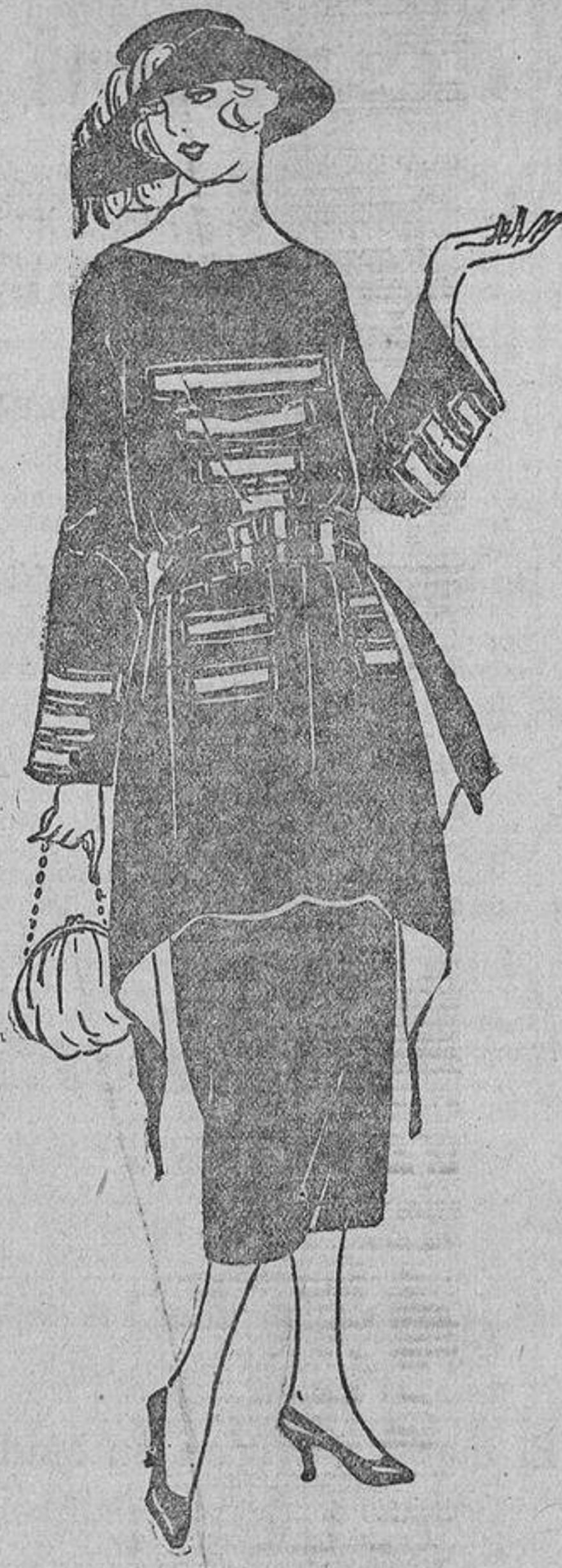
Sobre un vestido de «kasha» azul marino muy oscuro, unos galones de seda rojos con un filete verde cardenillo. La sobrefalda abierta detrás.