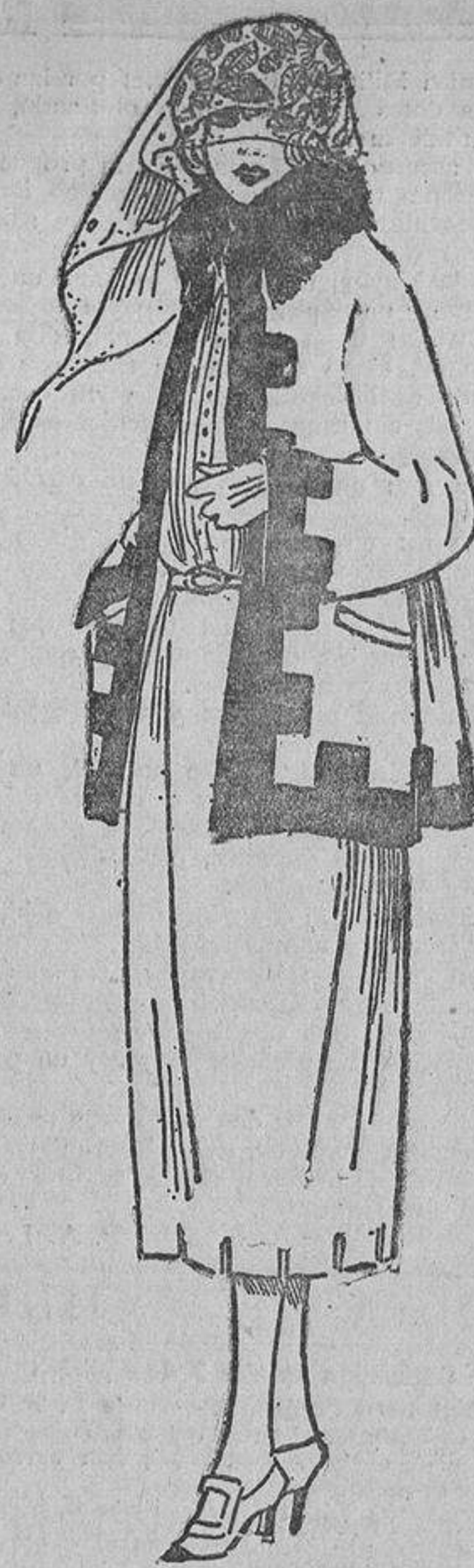
La falda cortada en forma de almenas; en la misma idea, la orla que bordea la chaqueta y puede ser de paño, terciopelo o cuero de distinto tono.

dable que ofrece una mamá joven y elegante acompañando a sus bebés, sanos, limpios y alegres.