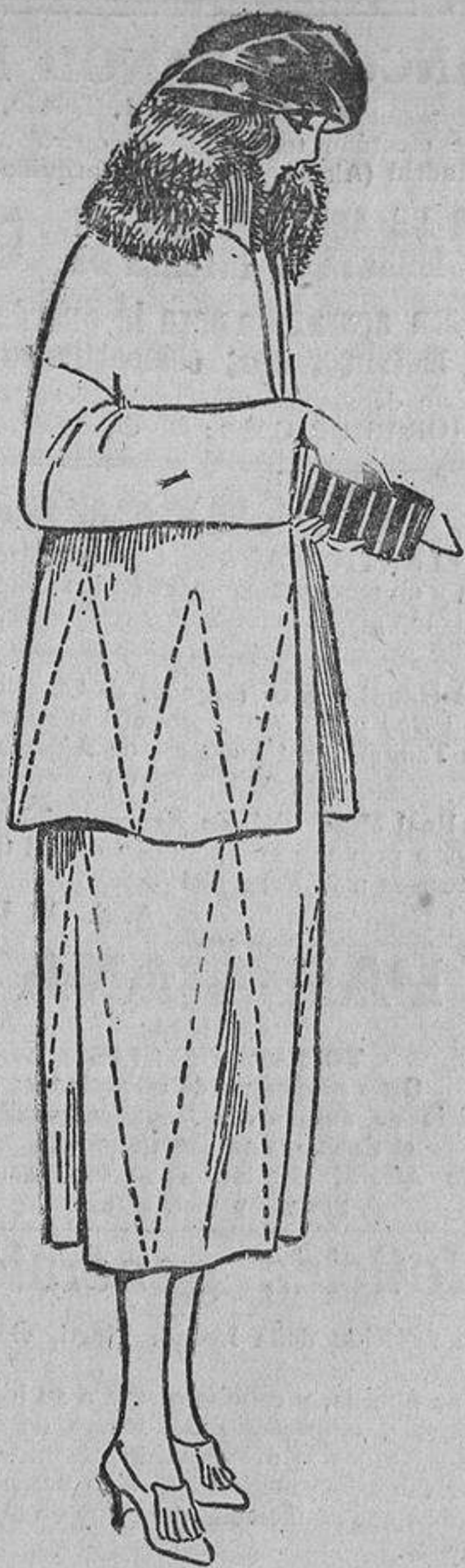
Gustan mucho estas chaquetitas flojas; ésta tiene un cuello de piel de marmota y unos pespuntos.

Sean cuales fueren las causas de este cambio, hay que reconocer que es muy favorable para las mamás, porque gana en ello su dignidad; para los niños, por su salud y educación más cuidada, y para el público por el espectáculo siempre agra-