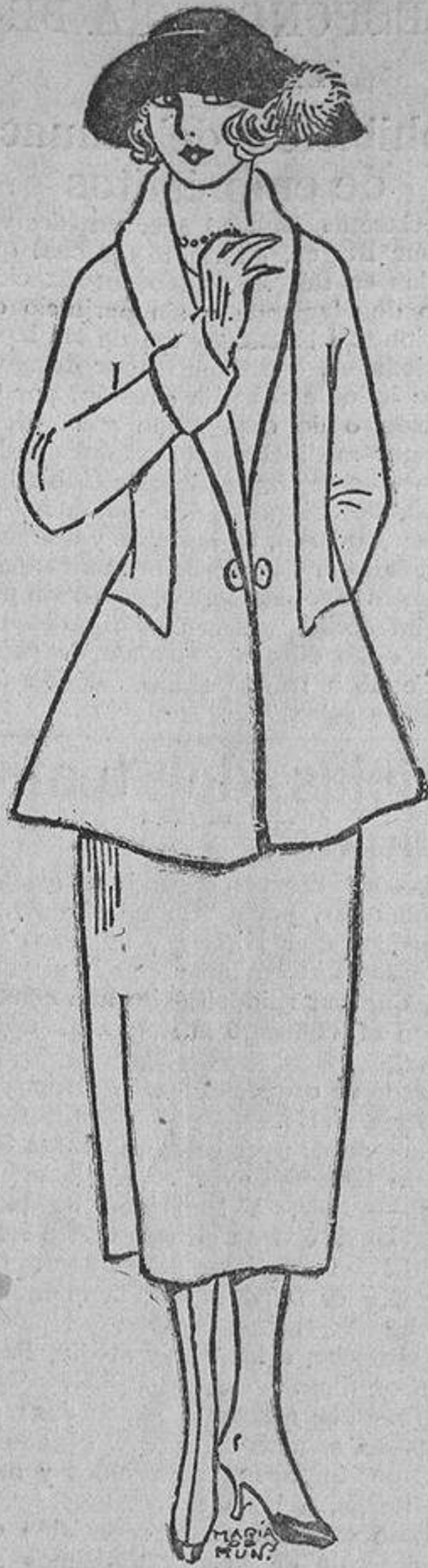
No permite adornos la corrección de un traje sastre; éste tiene un corte especial, a fin de dar algo de vuelo a la albeta.