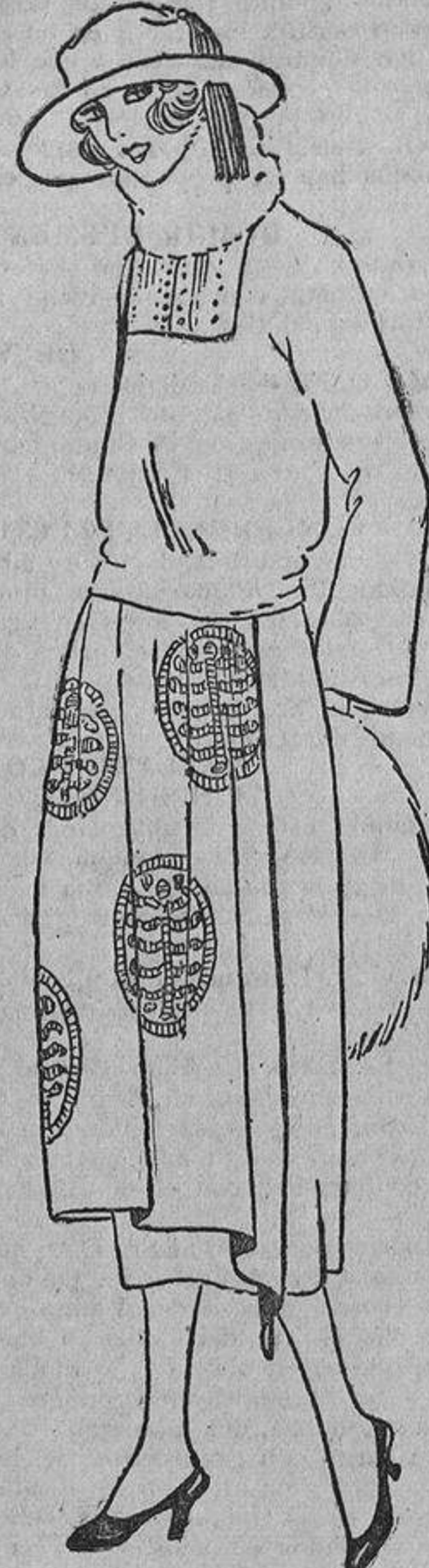
Para las mismas ocasiones se lleva este vestido de terciopelo negro, bordado con espumilla azul Talavera; delantal forrado de crespón, azul ídem.

Además, los magníficos candelabros de seminados sobre los muebles, dan un carácter aristocrático a las fastuosas mansiones modernas, carácter que es muy buscado a pesar de la democracia de estos tiempos.