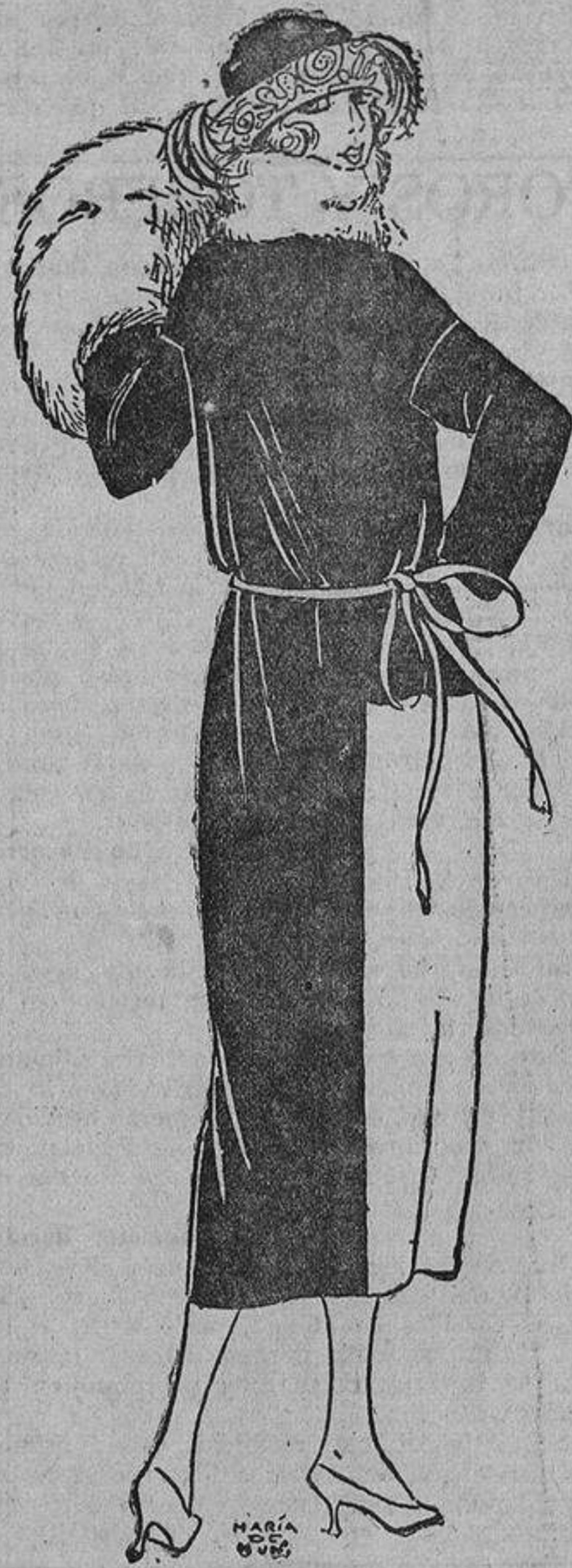
La combinación de tejidos acertados es de un efecto elegante, como sucede con este abrigo de raso negro o marrón, combinado con terciopelo negro, gris o marrón, o bien un grueso paño flexible mate.

Parecemos fatigadas de la crudeza impertinente de la luz eléctrica que fatiga la vista. Las velas, colocadas en modernos candelabros, proyectan una luz suave y temblorosa que hace brillar la cristalería y la plata, se multiplica en los espejos, realza el valor de los más insignificantes objetos, y no es dura para los rostros que han perdido el primer esplendor de la juventud.