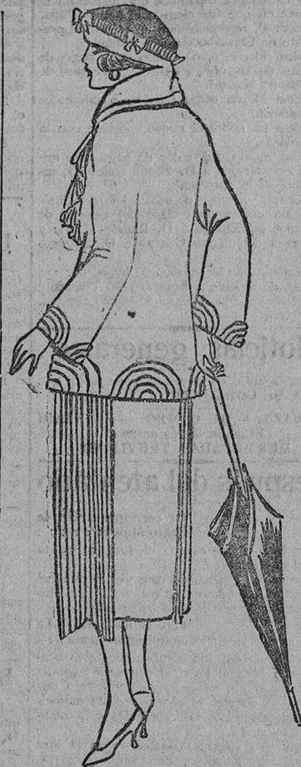
De paño pan tostado, aplicaciones de tela recortada sobrepuestas. Falda plisada delante.

en una modesta iglesia pueblerina, en un sitio pintoresco, ahí, lejos de los burlescos, de los envidiosos, de los indiferentes, de los «amigos»; en esas poéticas ermitas encavadas en los repliegues de las colinas que dan al mar, rodeadas de una naturaleza risueña y en que un sacerdote santificado por la vida sencilla, les da una bendición que es amuleto de la buena suerte. ¡Felices los matrimonios que pueden guardar el recuerdo inolvidable de toda esta sencilla y pacífica belleza!