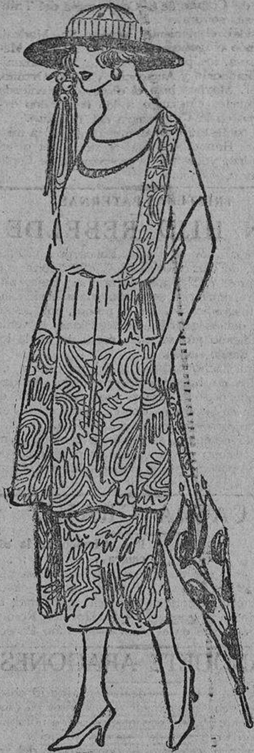
Puede ser todo del mismo tejido (crepón), liso y bordado, o bien combinado con dos tejidos, uno estampado y liso el otro... o con encaje...