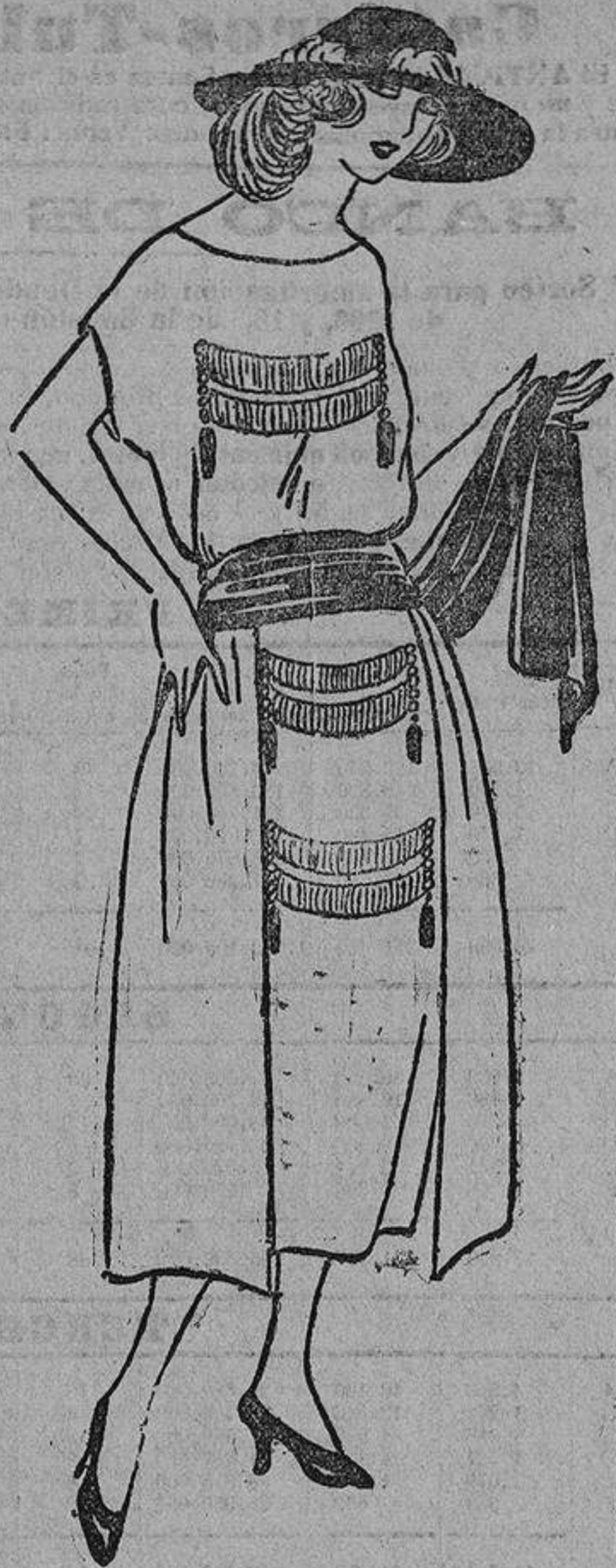
Este vestido puede hacerse en tafetán o crepón, con dos paños sueltos a los lados, más largos que la falda, y delante fleco, entredós y borlas de oro.

Aprobó la idea de esos novios sentimentales que ahora implantan el casarse