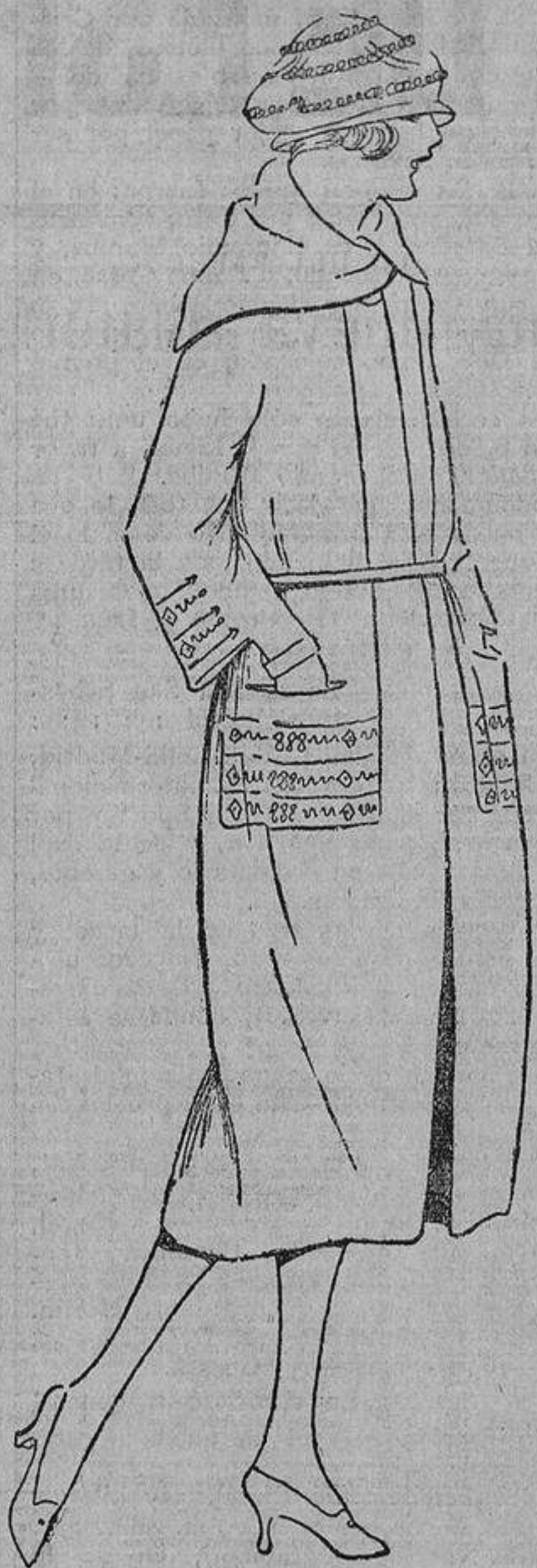
Para prevenirse contra los primeros frios, Carmela se ha mandado hacer este abrigo de terciopelo de lana color tabaco, adornado con unos bordados marrones.

Sobre esta idea he visto un bonito traje de baile muy fácil de confeccionar en casa. Se componía de un cuerpo en terciopelo negro ajustado; la falda, formada por tres tules sobrepuestos, en lila, rojo y azul suave; cada uno de los volantes recortado en ondas y ribeteado de u-