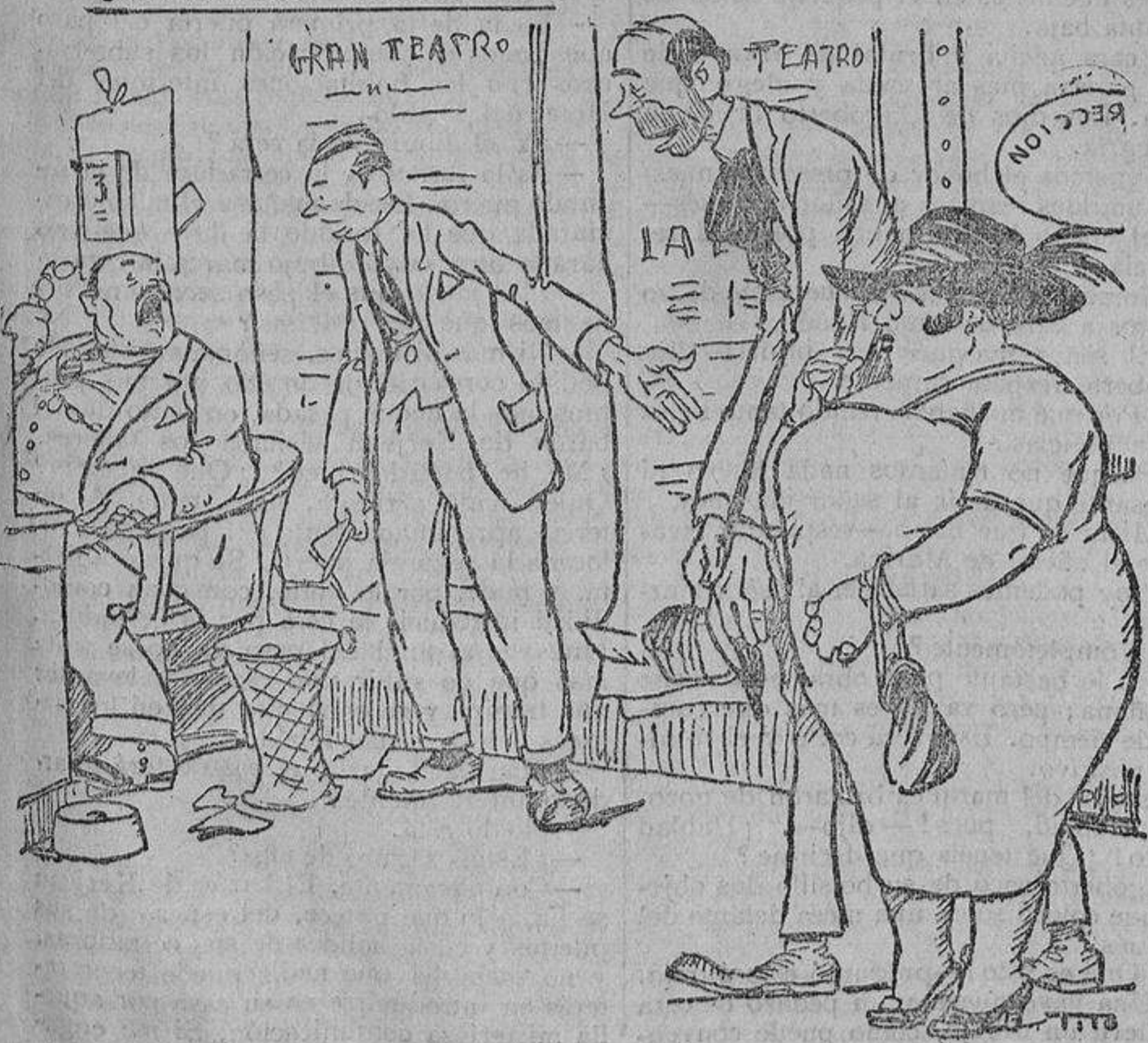
—Tengo el gusto de presentarle a la tiple ligera y al bajo!..