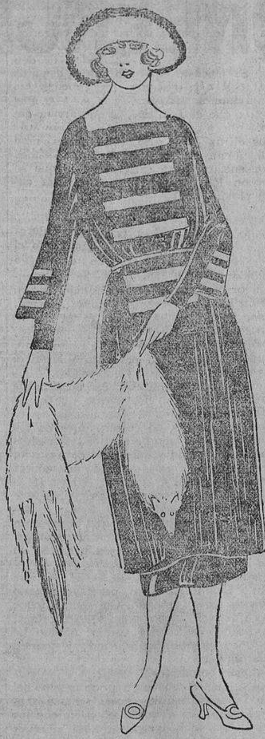
Se llevarán mucho las incrustaciones de paño, por ejemplo, azul «nattier», sobre fondo marino, como sucede en este modelo.