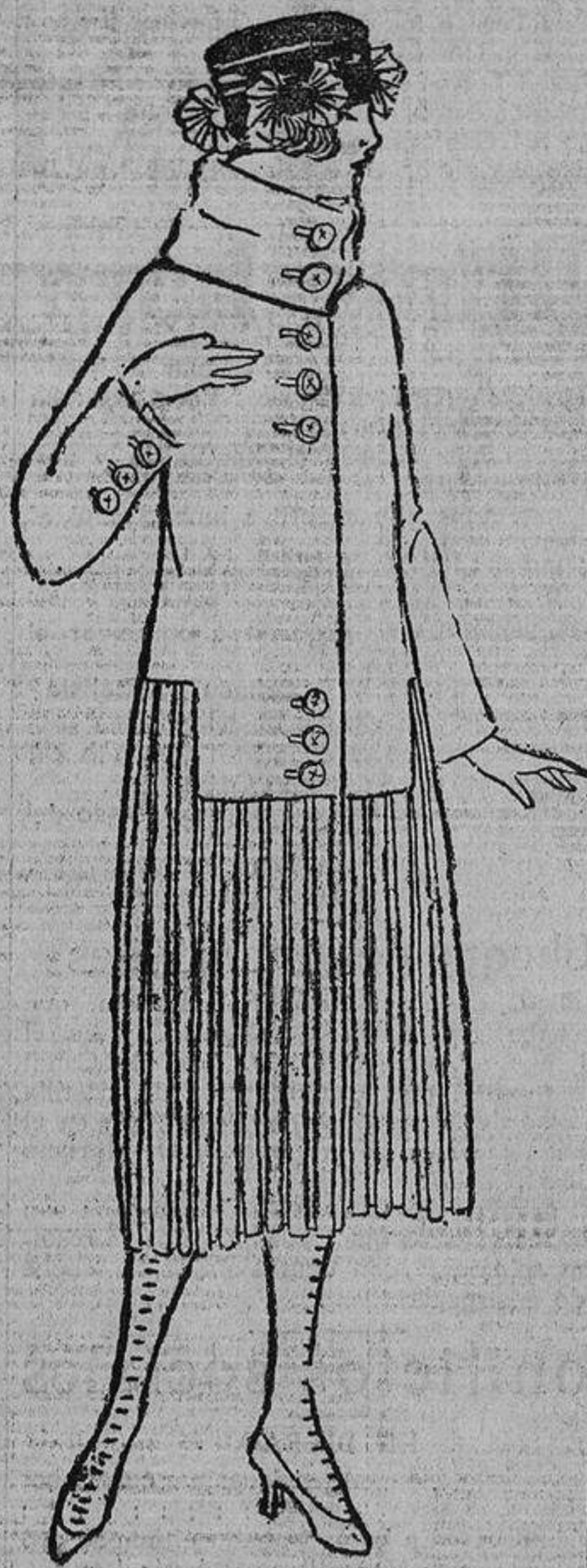
En vez de «plisés», que tanto se han visto, este modelo, de paño color arena, tiene unas tablitas y unos grandes botones de galaita.

El Gobierno ignora quizá que la mujer necesita desbordar su ternura, y lo hace con los perritos, en cuyos ladridos encuentran quizá remembranza de los vaguidos de los tiernos niños que ellas no han tra-