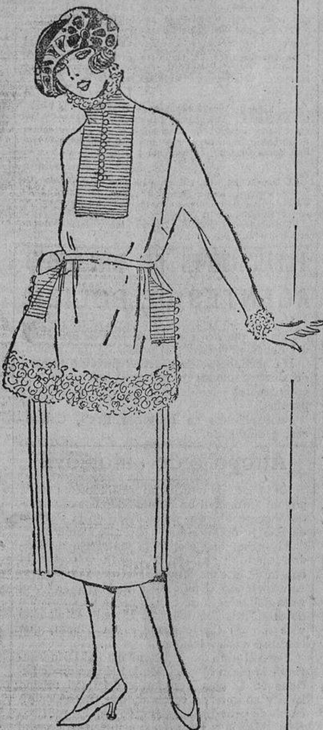
Puede meter sus manos en los bolsillos, que tienen unos pespunte grises, como los del cuerpo, que hacen muy bien sobre el fondo azul del vestido; pero su conciencia no estará tranquila porque lleva piel de cordero.