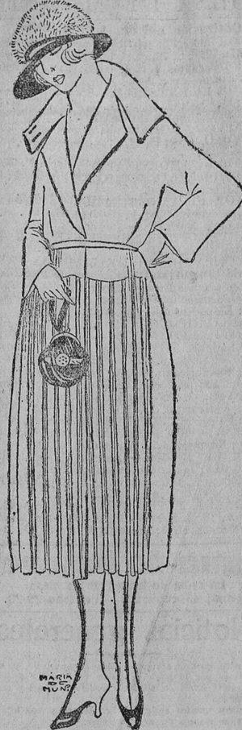
Otro «chic» abrigo; éste en gris perla, adornado con tablitas sólo en el delantero. La espalda es lisa.

do al mundo. Sensata o loca, la virgen solitaria comprende al animalito y el animal la comprende a ella.