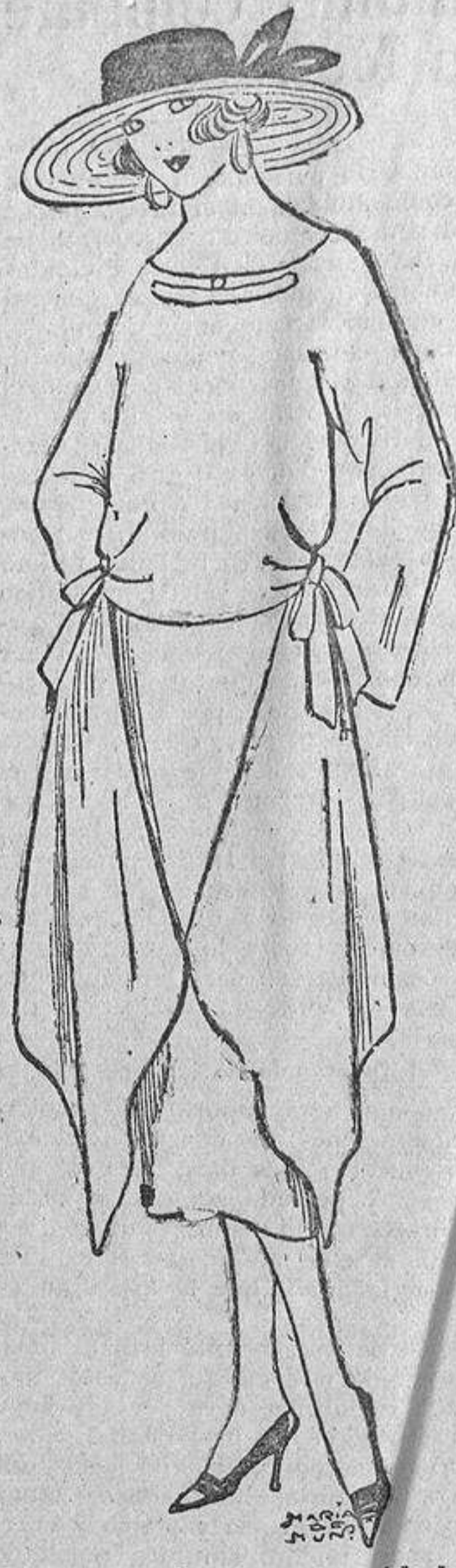
Senecillo, pero «dice algo» este modelo de raso flexible negro con dos pañuelos colocados como sobrefalda.

«cían los espectadores; pero sus escrupulos patrióticos fueron pronto dominados por el encanto sugestivo de las siluetas veloz-queñas, afrancesadas.»