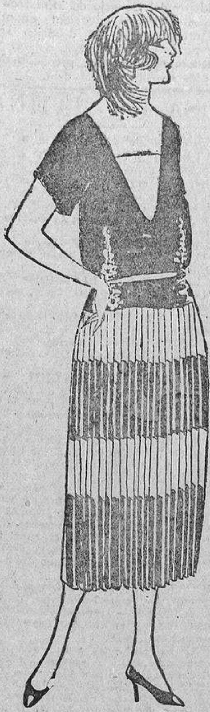
El cuerpo de crepón de lana verde mar, y a la falda plisada, de crepón, blanco y verde

¿Por qué han ido a inspirarse en las modas españolas, cuando en Francia tenían ancho campo donde inspirarse en modas exclusivamente francesas? Esto se de-