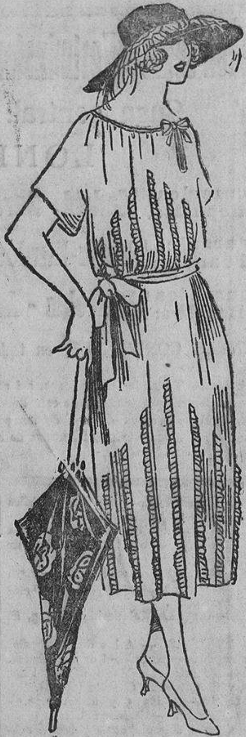
Muy «juven» este vestido recto, fruncido en el escote a lo «virgen», de crespón de China azulina y tiras plisadas de la misma tela.

Viene abril; adornemos nuestros sombreros con flores irreales y frutas fantásticas, porque, en verdad, los coloridos de estas flores son de tonos tan extraños, que la Naturaleza no los había previsto. Las espigas no son doradas cuando se lucen en los sombreros, y al ver las uvas