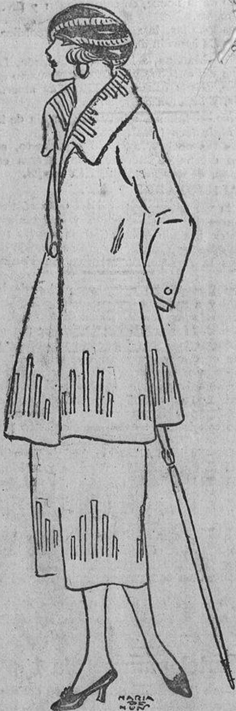
Para primavera, donde se permite a los trajes sastre más fantasía, este modelo adornado con trencillas o incrustaciones de piel de cabritilla.