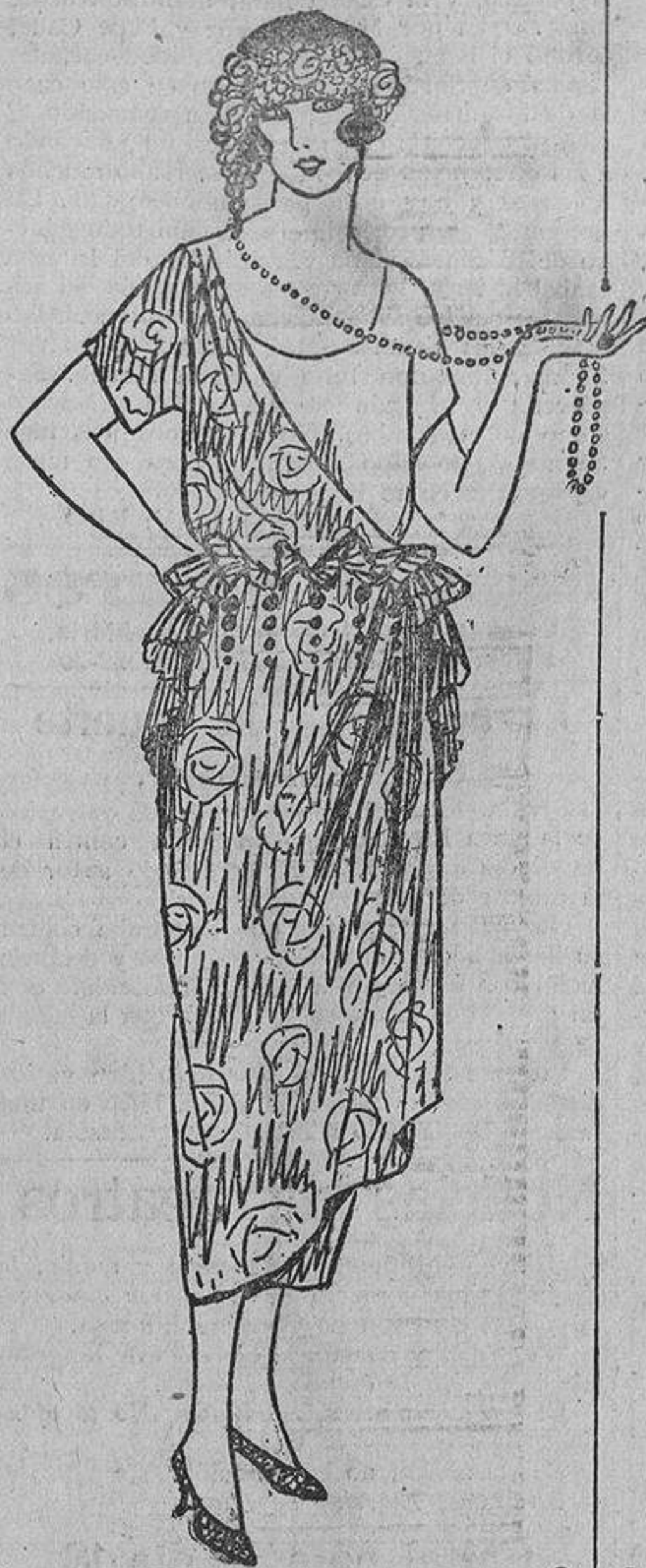
Para gran ceremonia, un vestido de caída flexible, brochado y en la cintura un «ruche» plisado del que caen unas cuentas.