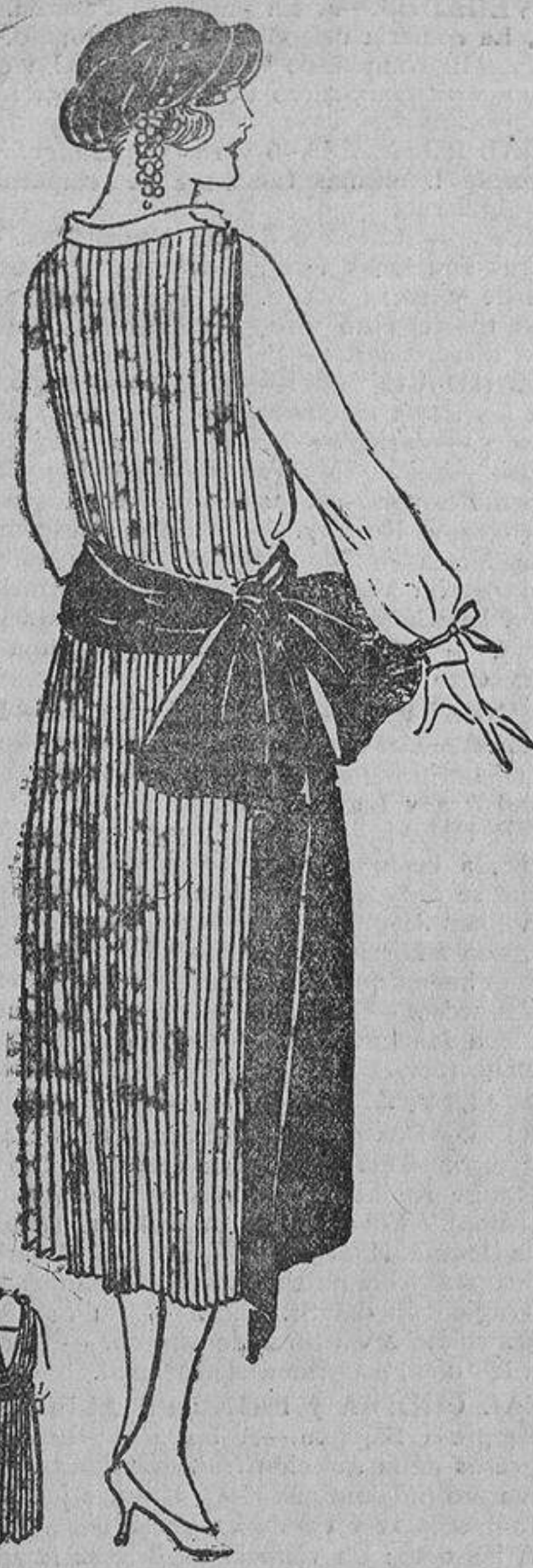
Para una delgada, este vestido de crespón de China azul «tennis» plisado. Banda de faya marino.

«Nuestras mujeres van desnudas», decía un moralista del año 1800, y añadía con una tolerancia sabia: «No quiero que se contrarie a las mujeres cuando sus acciones son inocentes (pero ¿y la moral?, diréis). Es el caballo de batalla de los tontos; ven la indecencia en la renovación. No les choca lo que ven; chillan por-