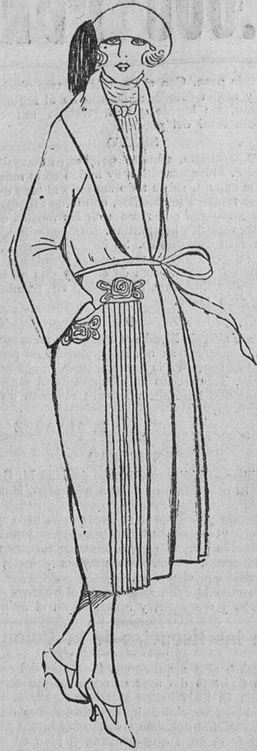
Un abrigo sencillo, con cuatro grupos de pliegues (dos delante y dos detrás) y unos bordaditos con «soutache», tono sobre tono.

El final de las líneas que bajan, son signo de neurastenia; las que suben indican confianza en sí mismo, fuerza moral. Deben casarse las líneas descendentes con las ascendentes, y así fundir las inquietudes en un optimismo sonriente.