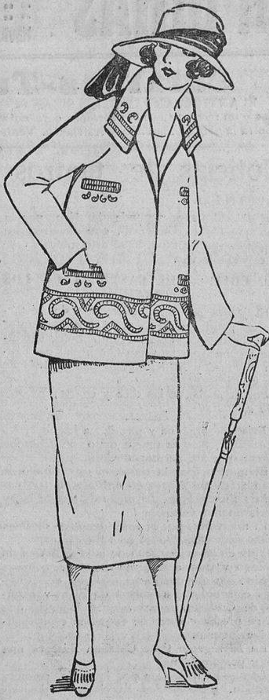
Para la primavera, este traje de paño gamuza color cuero con bordados del mismo tono.

Si el novio tiene una escritura grande e inclinada, no dudéis: es cariñoso, abnegado y exaltado. Lo casaremos, si os parece, con una escritura recta, es decir, de inteligencia suelta, no ignorando las realidades de esta vida, a la vez tierna y práctica, que encontrará las palabras necesarias para consolar a su marido exaltado, haciéndole ver la vida de color de rosa.