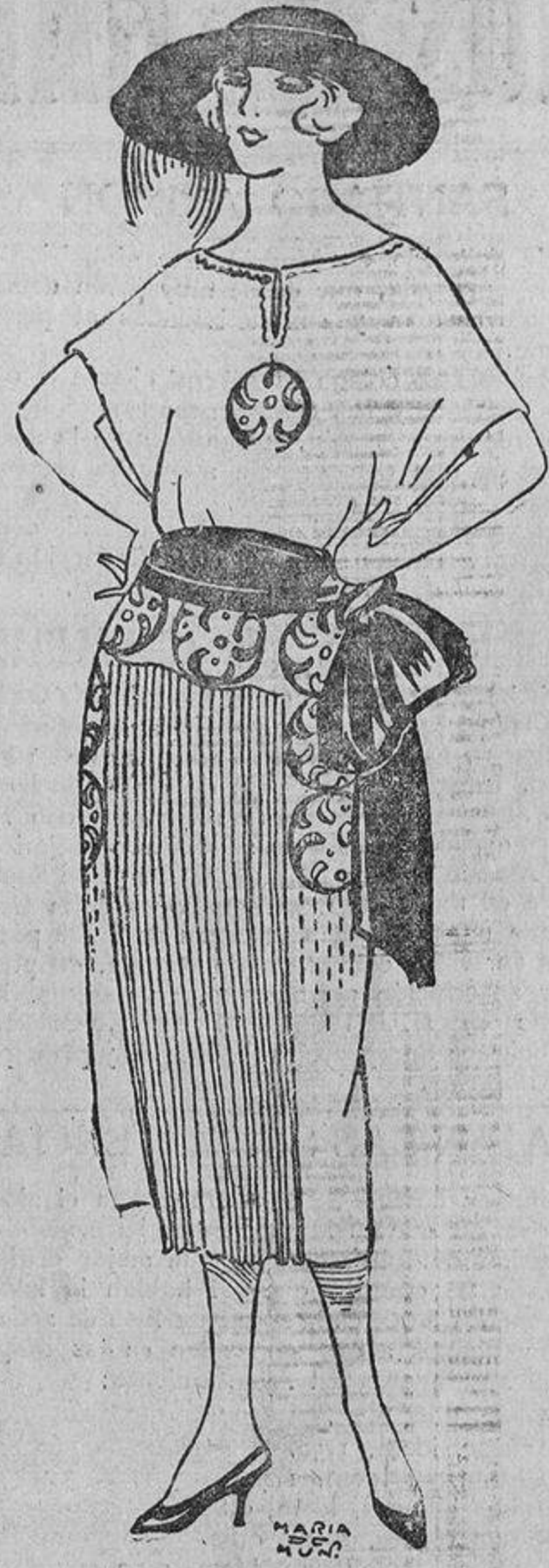
Es elegantísimo este modelo color cobre, plisado delante, con bordados de seda brillante negra y banda de cinta negra encerada.