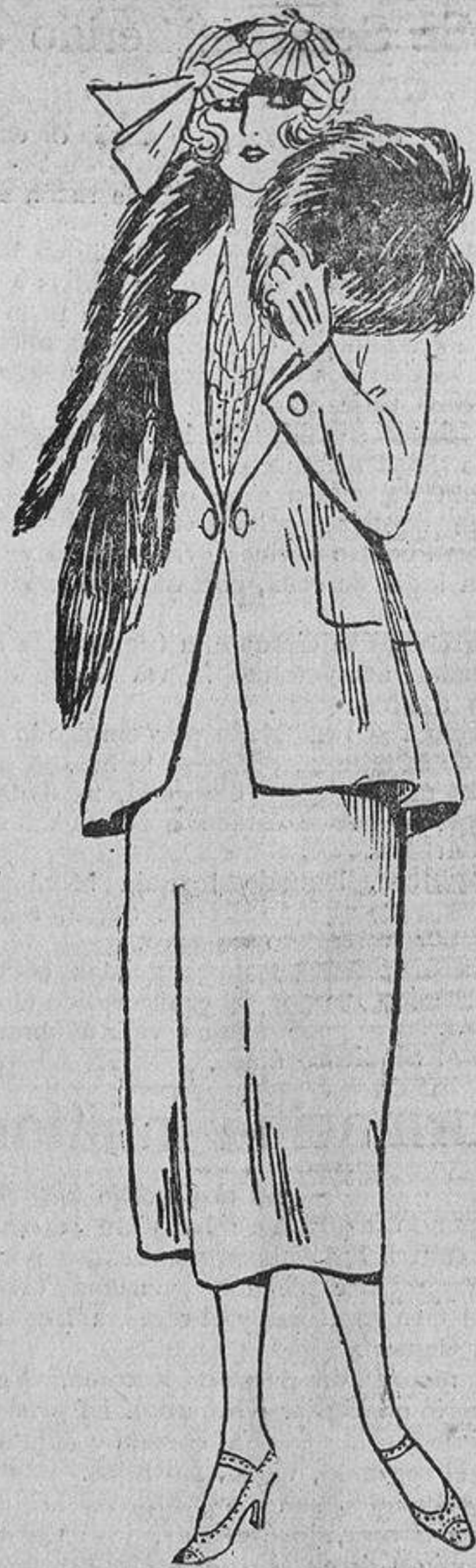
En un tejido inglés, claro u oscuro, todo el «chic» estriba en la impecabilidad de la hechura.