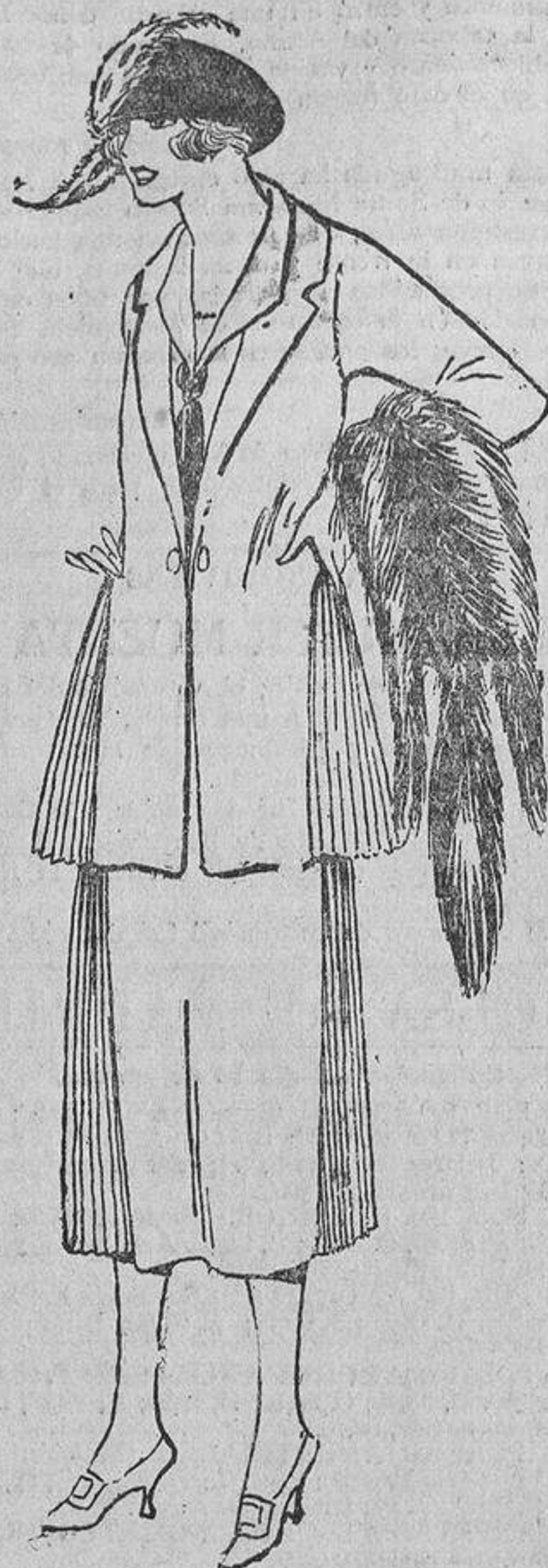
En los trajes de primavera está permitida la fantasía; así vemos éste, con fuelles plisados en la chaqueta y en la falda.

prudente Emperador Ken-Li, amenazando de muerte a toda mujer de su raza que incurriese en esa mutilación. Las tártaras, que rabiaban, envidiosas, viendo a las chinas andar con el suave balanceo de los juncos del Hoang-Ho, mientras que ellas, por voluntad imperial, caminaban rígidas, idearon una estratagema. Colocaron en sus calzados unos talones de diez centímetros de altura y bastante anchos, situados en mitad del pie, y que las obligaba a andar balanceándose para recobrar el equilibrio... y se salieron con la suya.