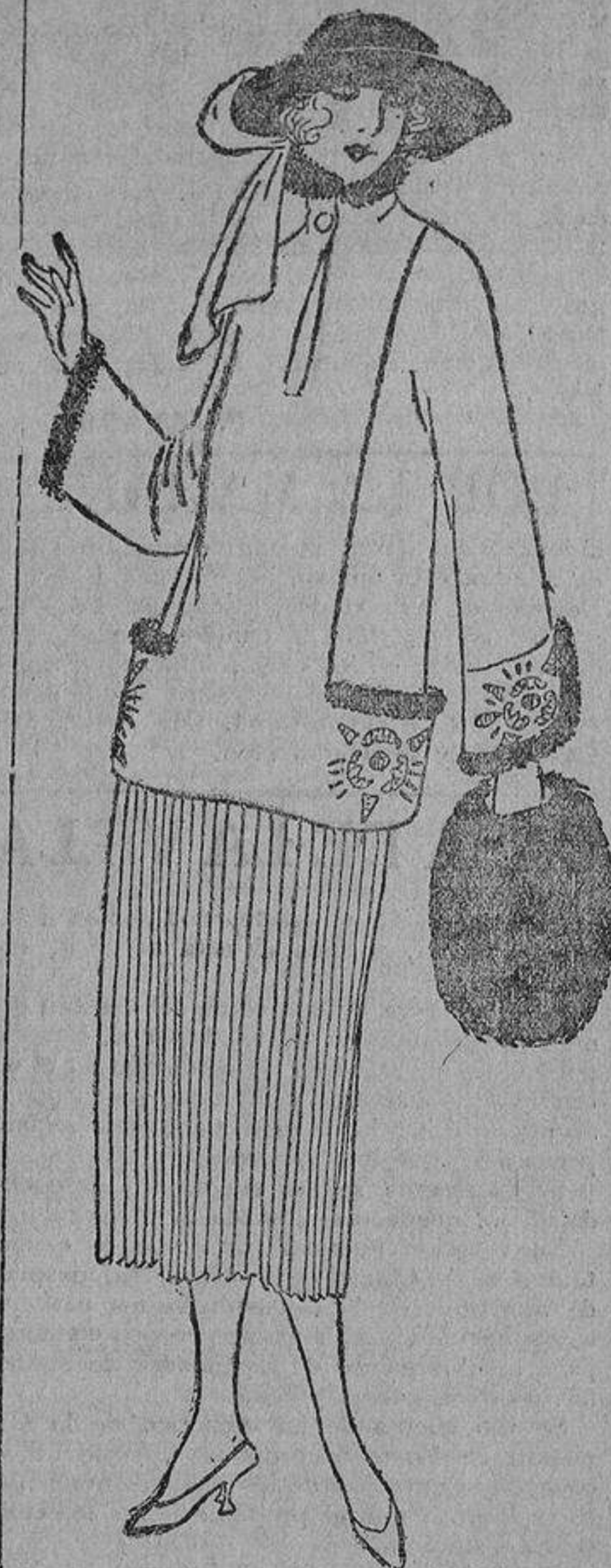
Rojo oscuro, piel negra y bordados idem. La falda plisada solamente delante, de lado a lado.

Muchas señoras no son amigas de estas fotografías para sus retratos; les gusta más verse la cara bien blanca, sin una sombra, como en los retratos corrientes; están más guapas; esos retratos vulgares les dan una belleza de cramo, de «bombráctero»; pero les resta personalidad, «carácter».