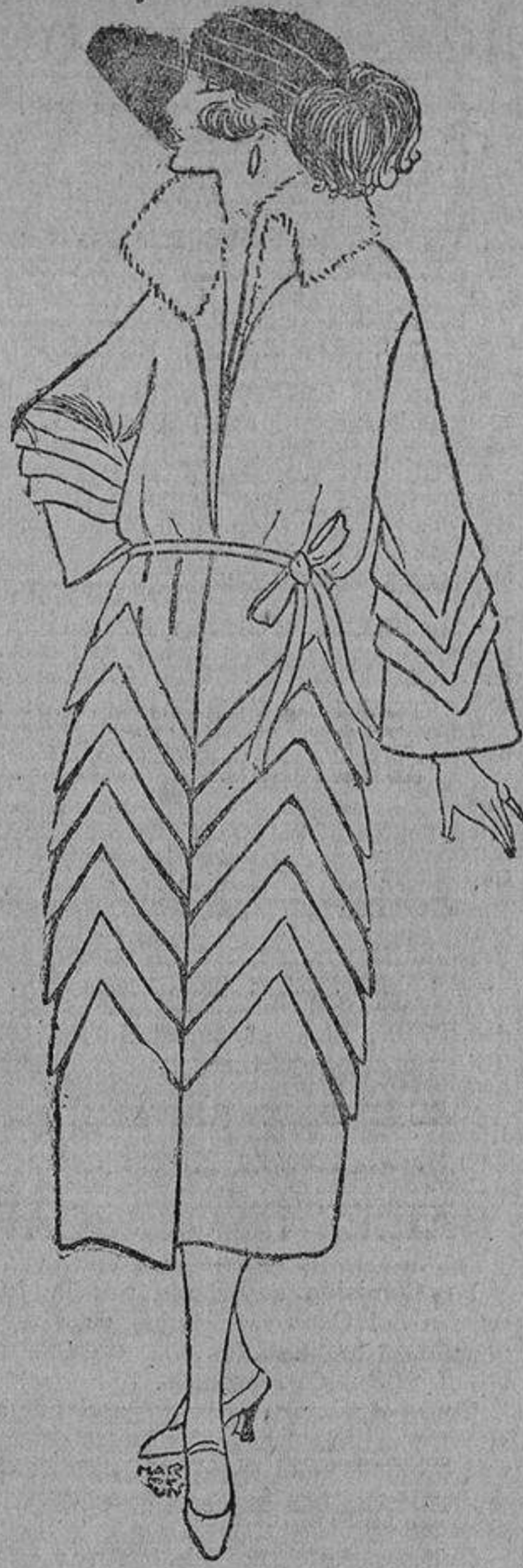
Elegante abrigo, de paño Suecia, adornado con bieses de su misma tela.