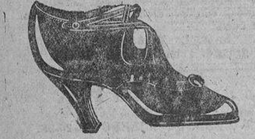
Zapatos charol, corte cruzado, piso corriente, tacón Luis XV. A ptas. 22.