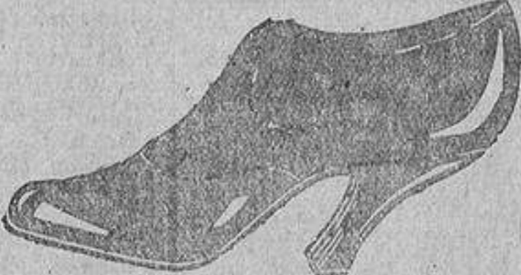
Zapatos d'óngola, pala de charol, tacón sueca, clase 1.ª. A ptas. 27.