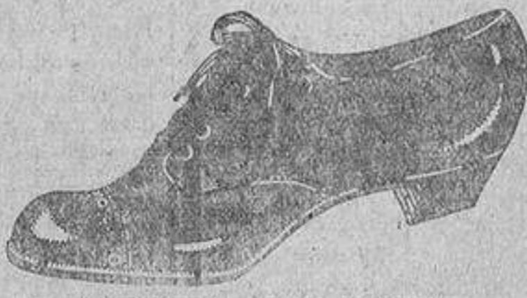
Zapatos d'óngola, oscarita y charol. De ptas. 17 a 27.