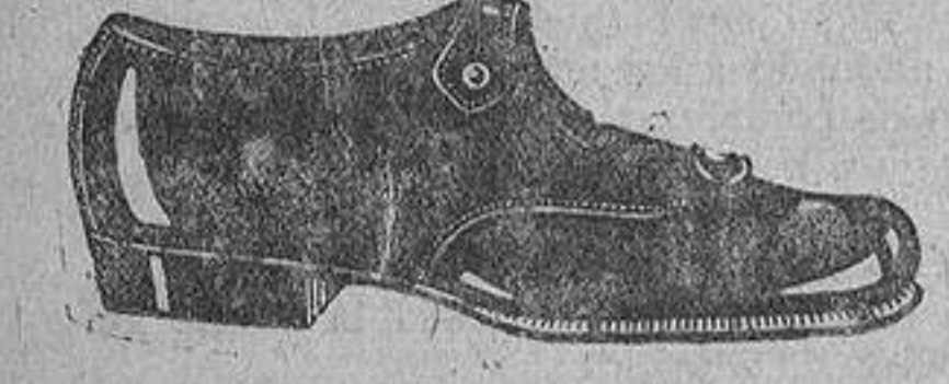
Zapatos charol, corte «Mercedes», piso corriente, tacón inglés. De ptas. 10,25 a 11,25.