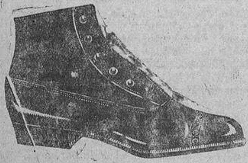
Zapatos charol, corte «Mercedes», piso corriente, tacón inglés. De ptas. 17 a 27.

Barcelona, Almería, Alicante, Bilbao, Cádiz, Cartagena, Gijón, Granada, Málaga, Palma de Mallorca, Santander, Sevilla, Valencia, Valladolid, Zaragoza.