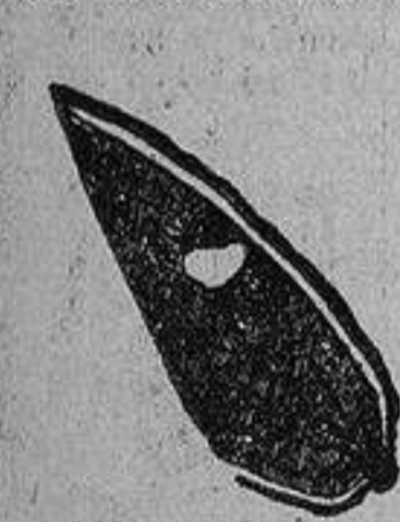
Un seno inusualmente antes del tratamiento.