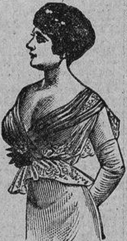
Un seno bien desarrollado después de haber experimentado mi método.

y seguí hasta los consejos de varios especialistas, sin ningún resultado. Los solos resultados que logré obtener fueron mucho dinero perdido.