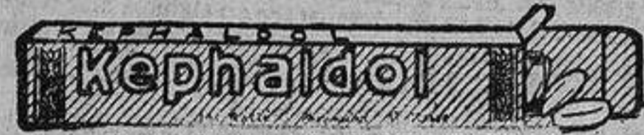
Facsimil de un tubo de KEPHALDOL

Todos estos sufrimientos, tan dolorosos por su carácter agudo, desaparecerán desde ahora fácil, y rápidamente, con algunas pastillas comprimidas de KEPHALDOL. Si vuestra ciática es muy violenta ó muy antigua, será tal vez necesario tomar dos ó tres pastillas durante algunos días; pero no olvidéis que una pastilla comprimida de KEPHALDOL no cuesta más que doce céntimos y medio, y que podéis absorberla, sin peligro, pues el KEPHALDOL es inofensivo como el pan que coméis y el agua que bebéis.