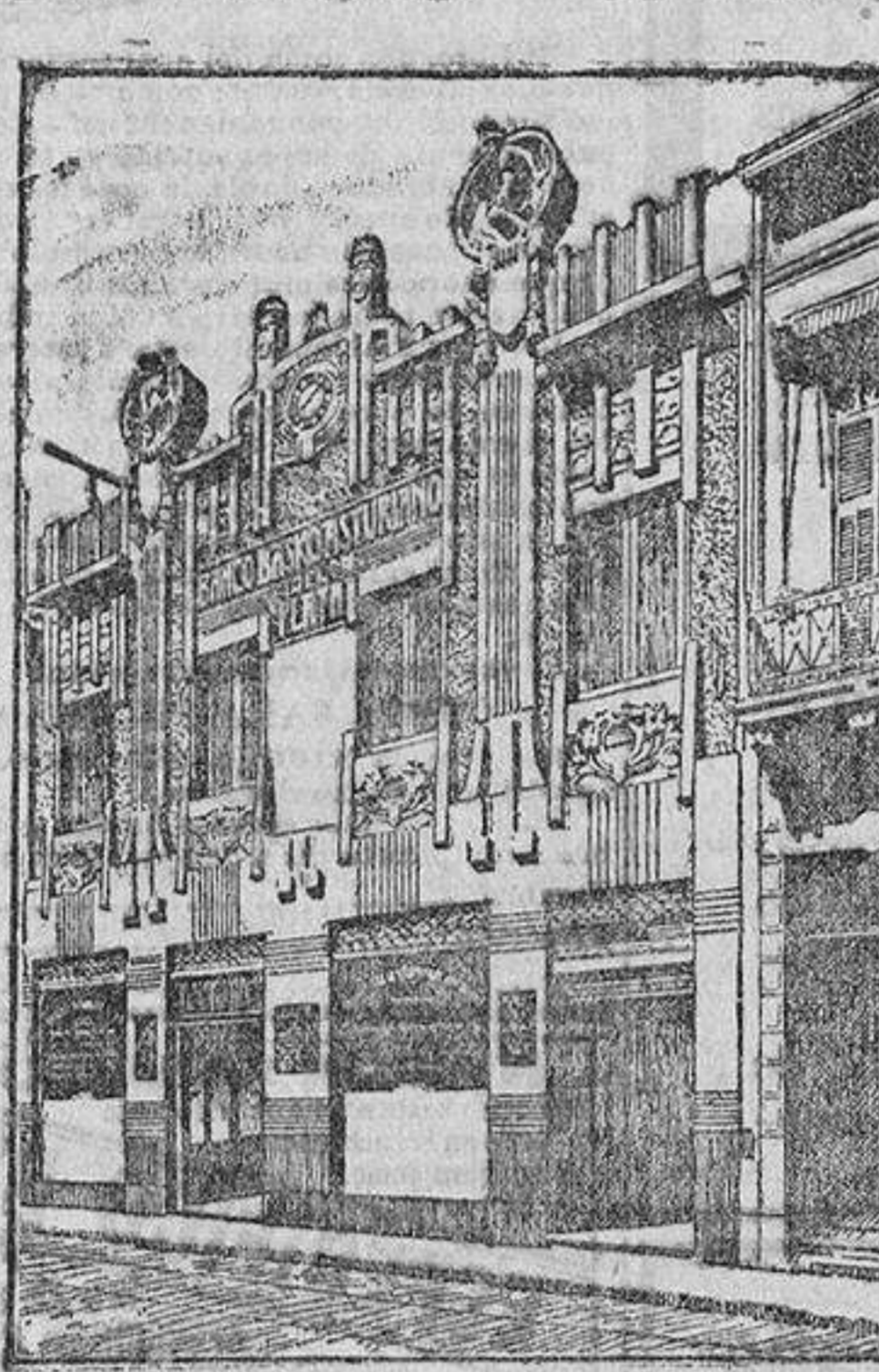
EDIFICIO DEL BANCO

Los grandes Mercados del Plata consumen anualmente del Extranjero productos por valor de 500 millones de pesos oro, y de España sólo 14.