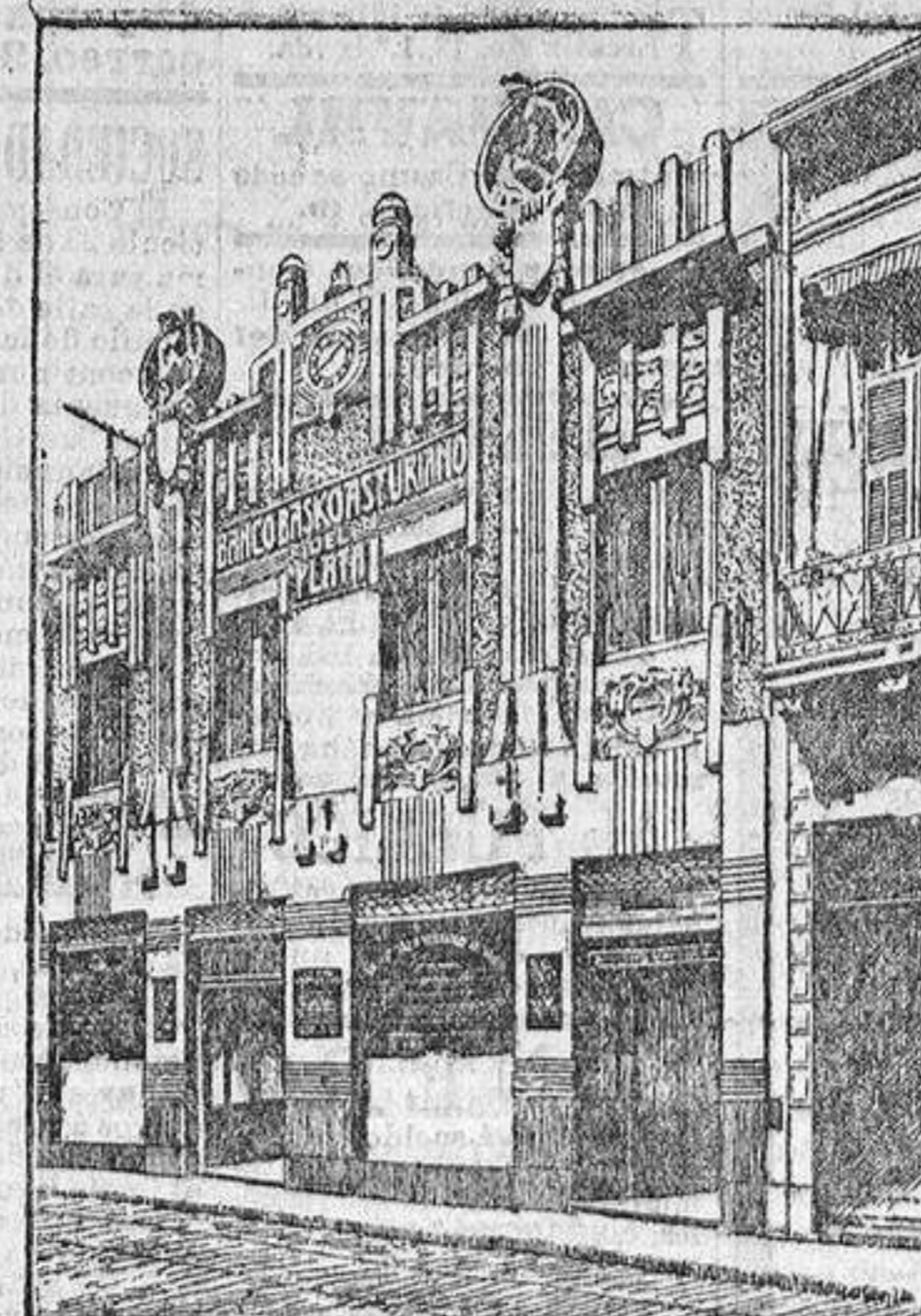
EDIFICIO DEL BANCO

Empresa Bancaria y Mercantil de intercambio con España