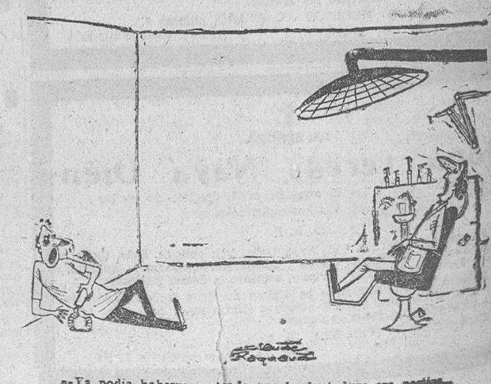
—¿La podía haberme avisado que la dentadura era postiza?