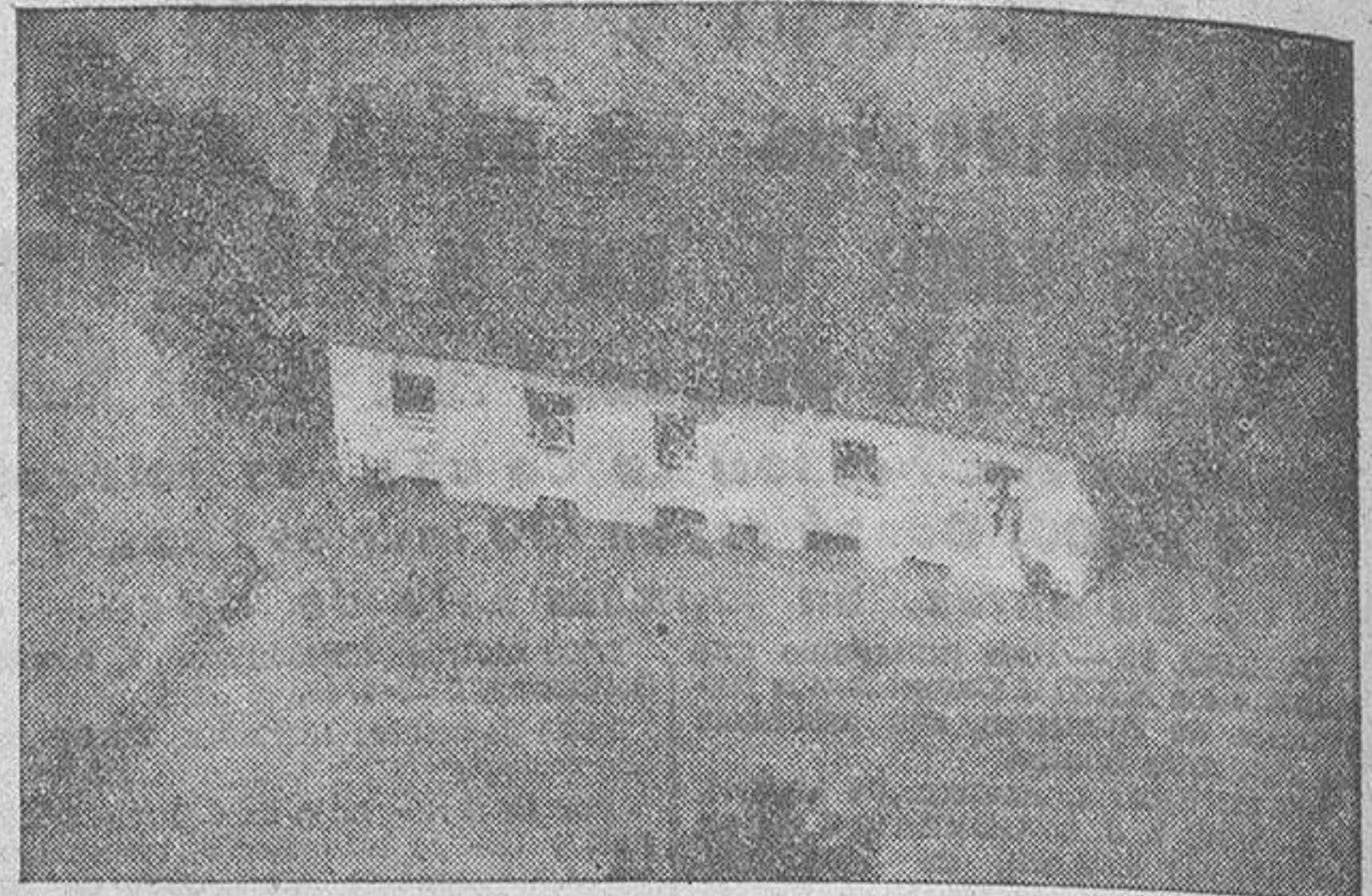
Como consecuencia de torrenciales lluvias recientes, el río Inn rompió sus diques extendiéndose por la campiña bávara y causando daños que se calculan en varios millones de marcos. Estos habitantes de una casa de Neuhaus se tuvieron que refugiar en los pisos altos de su vivienda y aguardar allí a la llegada del oportuno socorro