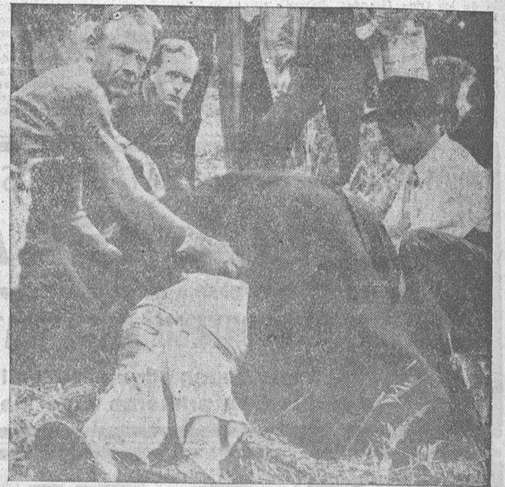
Un sacerdote católico recibe la entrecortada confesión del corredor automovilista argentino Onofre Marimón, que sufrió un accidente mortal en Nurburgring (Alemania occidental) cuando participaba en la carrera para el gran premio automovilista de Europa. Su padre, excampeón argentino, asistió a la trágica escena