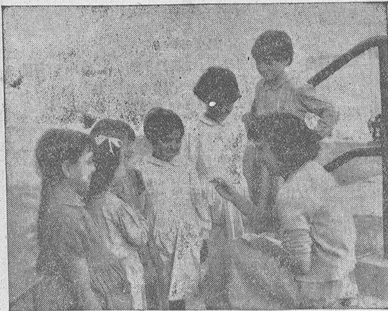
Con la agradable brisa marina curtiendo sus rostros, las chiquillas atienden a las explicaciones de la profesora. Así, poco a poco, van iniciando un aprendizaje que en sus casas, desgraciadamente, nunca podrían alcanzar