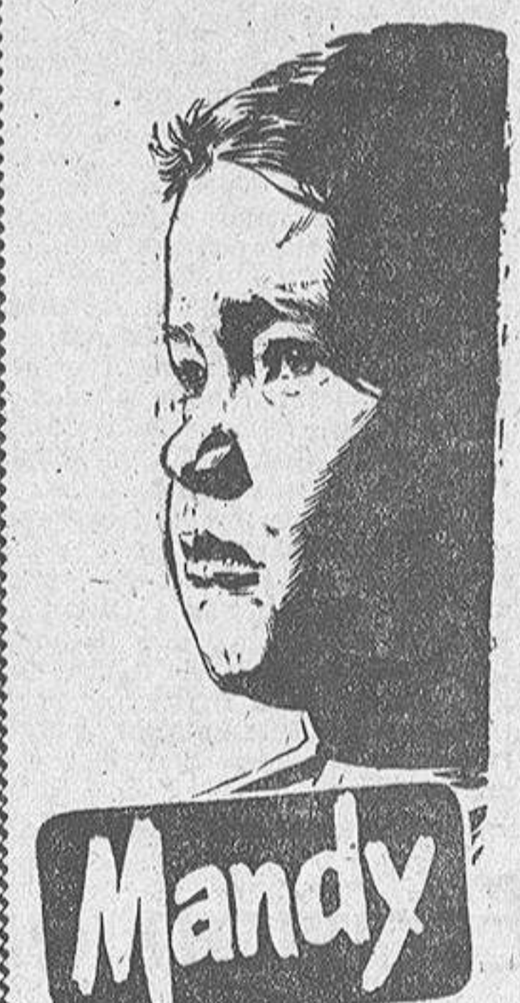
Mandy (La pequeña Belinda)

LA PELICULA QUE PENETRARÁ EN LO MAS HONDO DE SU CORAZON (CONTINUA EN SEXTA PLANA)