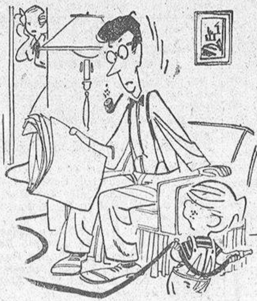
—¿Por qué empezáis a agitarnos antes de saber lo que pretendemos hacer?