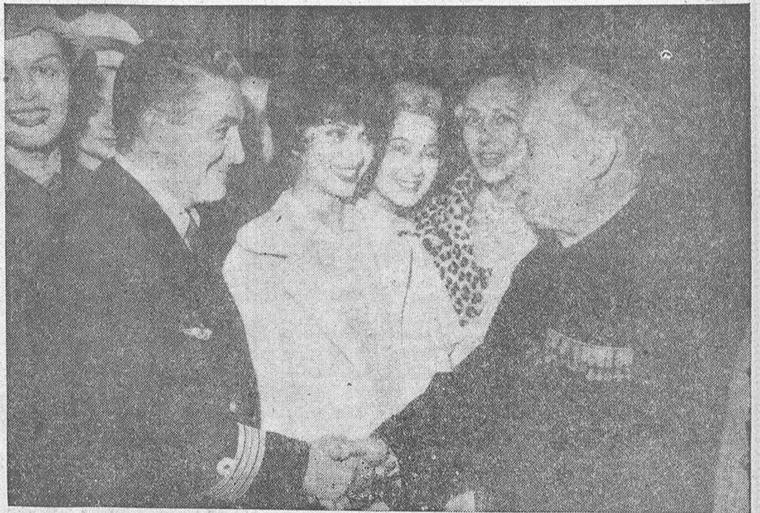
Un canónigo francés, el abate Kir, diputado y alcalde de Dijon, se despide del jefe del aeropuerto, parisiense de Orly momentos antes de tomar el avión al frente de una extraña "troupe" con destino a Dallas, capital de Tejas, a donde van en misión de fraternidad con motivo de las fiestas de dicha capital. Acompañan al canónigo varios escritores, el pintor Bernard Buffet, y una quincena de maniqués que exhibirán ante los tejanos las bellezas que el arte de la vieja Europa suele agregar a la belleza natural.