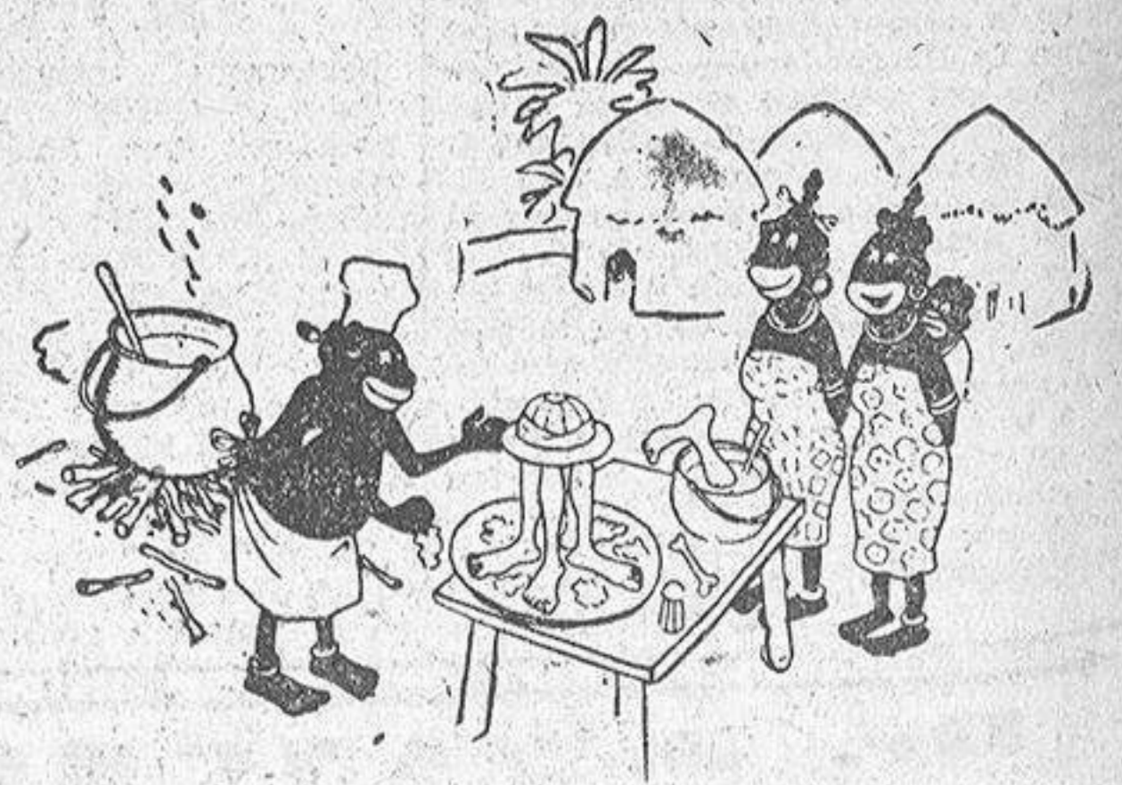
—El nuevo cocinero tiene una fantasma especial para presentar sus platos