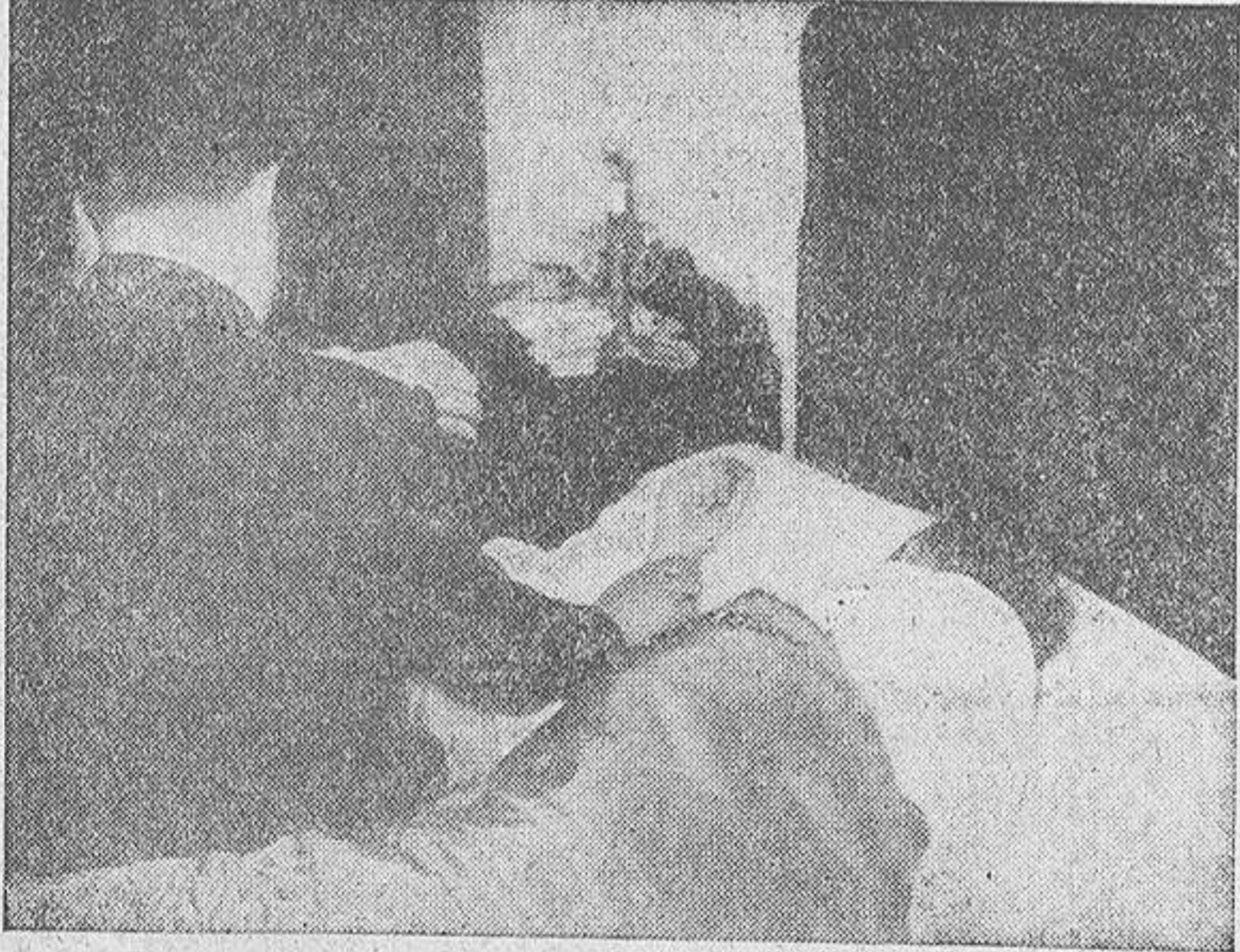
Una escena de cualquier domicilio de La Coruña: un enfermo de gripe y el médico reconociéndolo. En este caso el doctor poco puede recetar; un par de días en cama, y listo.

Pero en esos 35.000 no para el número. Se espera que en un plazo muy breve, cuatro de cada diez coruñeses hayan pasado bajo el manto de la gripe. Sucede una cosa; la gripe es tan sumamente benigna, que por lo regular basta con un par de días en cama. Ataca con preferencia a los niños. Normalmente es frecuente que en una casa donde hay varios chiquillos coincidan todos al mismo tiempo en la cama. A los chiquillos la temperatura les ataca de firme. Hubo casos en que el termómetro llegó a marcar más de los 41 grados. (CONTINUA EN SEXTA PLANA)