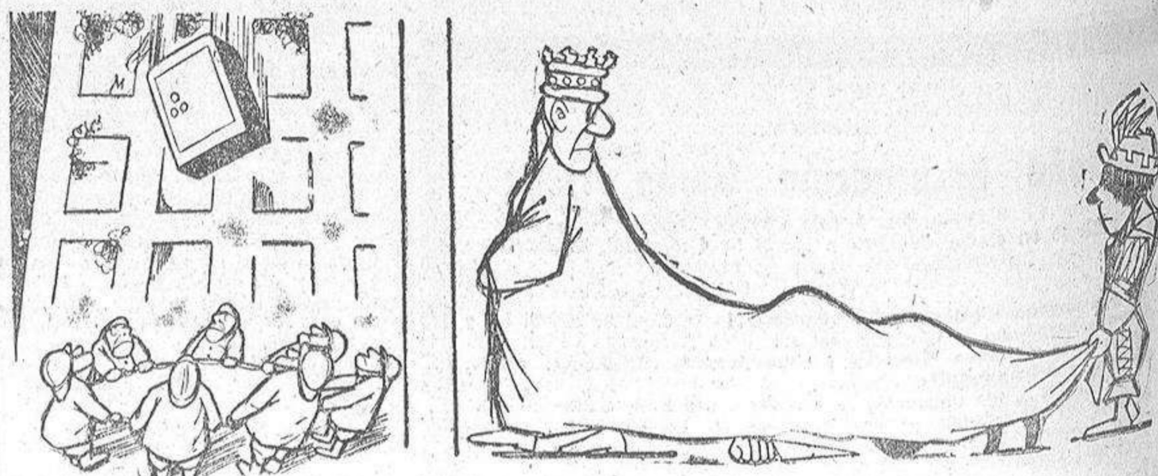
Lo primero que se salva