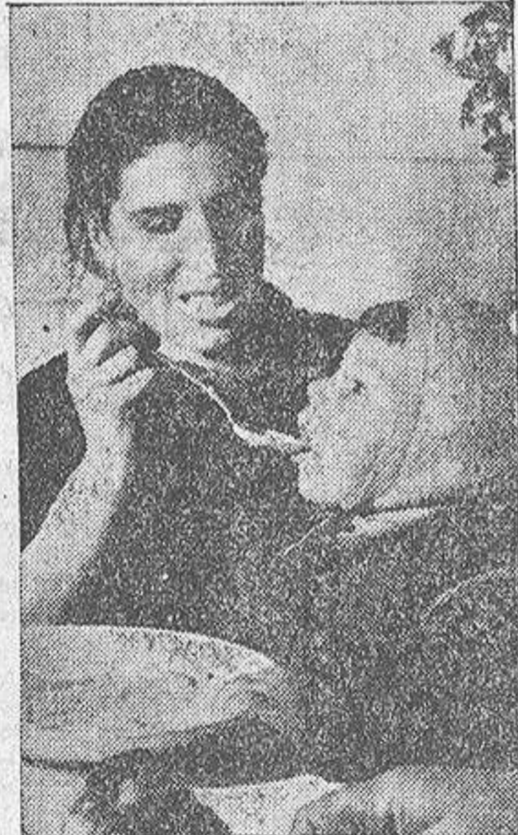
Esta pobre mujer, habitada de la Cocina Económica, comparte el alimento con su hija.

RESPUESTA: Si además de esos aumentos viene abonando las repercusiones contributivas, no se le puede incrementar. En caso contrario, el incremento habría de reducirse a la diferencia entre lo que debía abonar, incluidas esas repercusiones y lo que realmente paga.