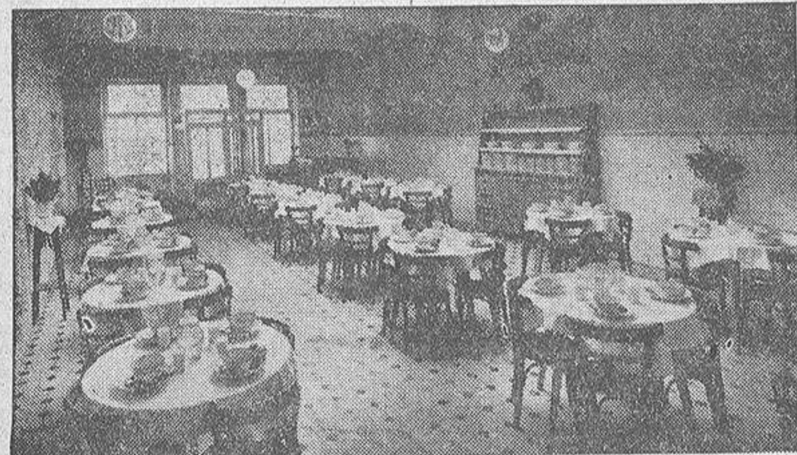
He aquí un magnífico aspecto del magnífico comedor de la Cocina Económica de La Coruña.

—Es mi primera vedete. —¿Buena? —Figurate. Nito ahora no me interesa. Me acerco a la vedete. (CONTINUA EN OCTAVA PLANA)