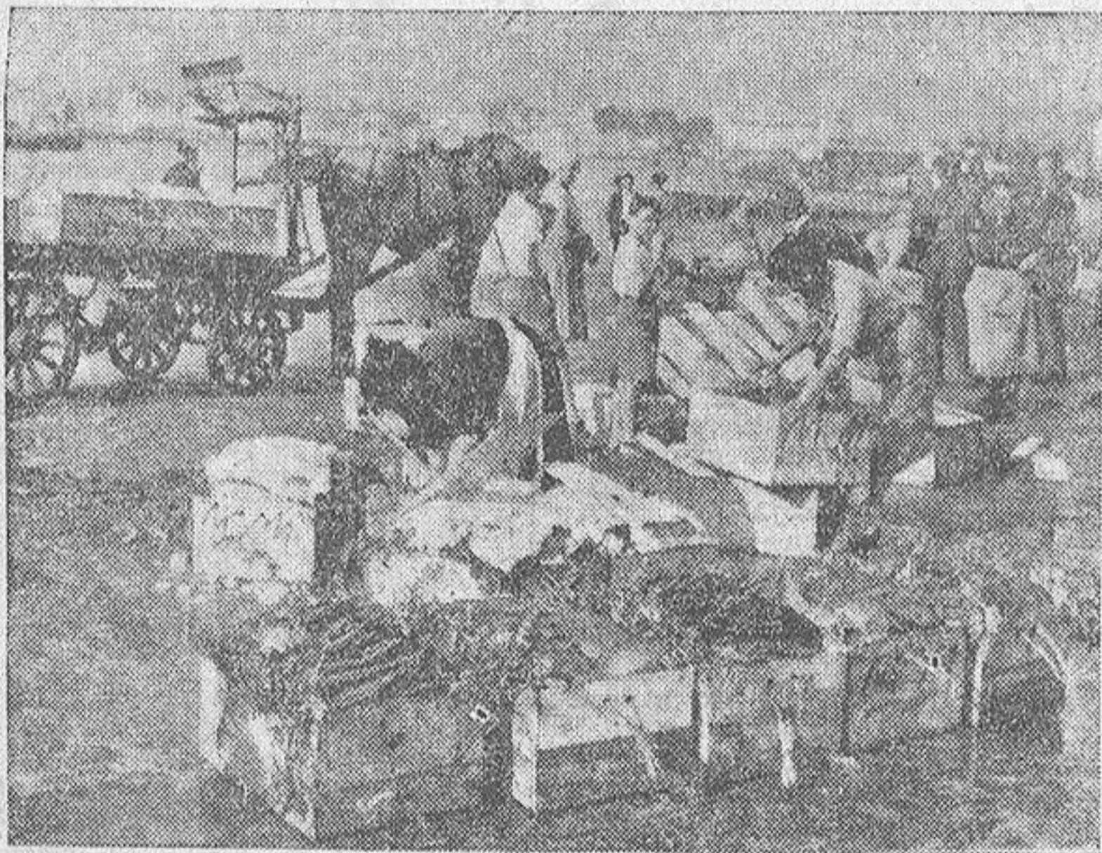
La preparación y envasado del pescado con destino al interior de España o extranjero es constante y agrupa un gran número de hombres y mujeres, que lo mismo envasan pez espada y marrajo para Francia, que calamares para Italia, o merluza para Madrid. La foto recoge uno de estos momentos

cientos es de menor coste o inferior, que son los que casi únicamente se consumen en los hogares humildes. Llegamos a la conclusión de que estas especies, sin ser numerosas, son arrojadas en su mayor parte en los puertos para abono de los campos, por tener unos gastos cuya repercusión es bien notoria en los mercados. Si sumamos al bajísimo margen comercial asignado a armador y exportador (si el pescado se envía al interior), los gastos de preparación, transporte, arbitrios, Obras del Puerto y merma natural, dan exactamente un importe igual al del precio de venta en el mercado. Con esto se demuestra que un kilo de chicharro u otra especie, que tanto beneficio reportaría a estos hogares menesterosos, no hay más remedio que utilizarlo con otros muchos kilos de pescado, como abono. No podemos, pues, dedicarnos a la captura de especies baratas, ni industrializarlas, porque no compensa en atención al carbón, aparatos, preparación o transporte empleados.