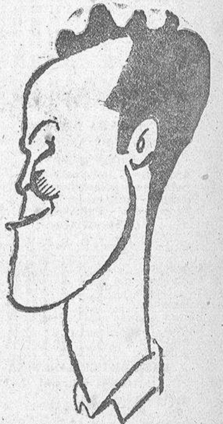
BADENES, delantero centro de la selección española, autor de cuatro de los siete goles marcados al equipo nacional helénico

MELCON: Manifestó que estaba satisfecho del resultado y que había dicho a los jugadores del equipo A, que a ver si podían lograr un resultado parecido.