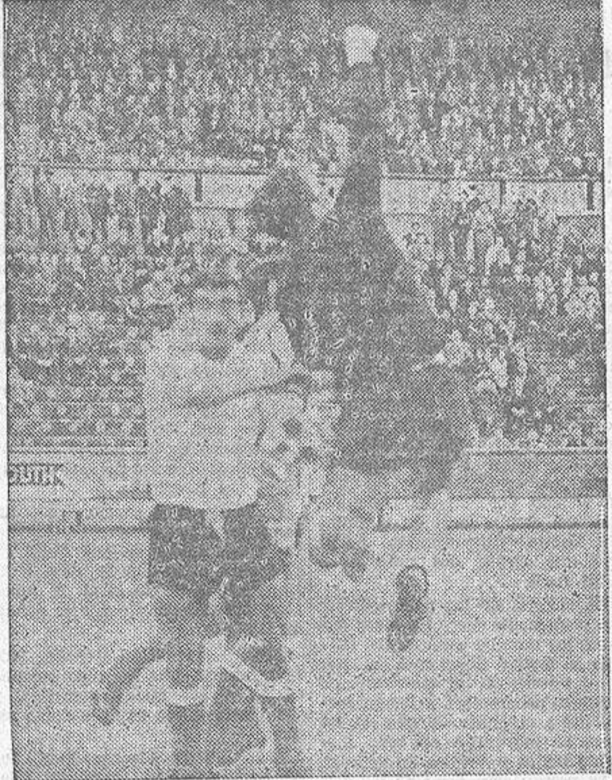
El portero visitante acierta a despejar de puños un balón lanzado sobre sus dominios.

GULLON meto el pie y marca el único tanto de la tarde. No es mucho lo que el partido jugado ayer entre el Real Santander y el Real Club Deportivo dio de sí para el comentario. Partido de escasa calidad futbolística y de no considerable emoción a pesar de los setenta y cinco largos minutos que se prolongó la permanencia de los dos cerros en el marcador, con grave peligro para el equipo de casa, y no obstante, también, ese cuarto de hora final de difícil sostén, por parte del vencedor, de su menguada ventaja.