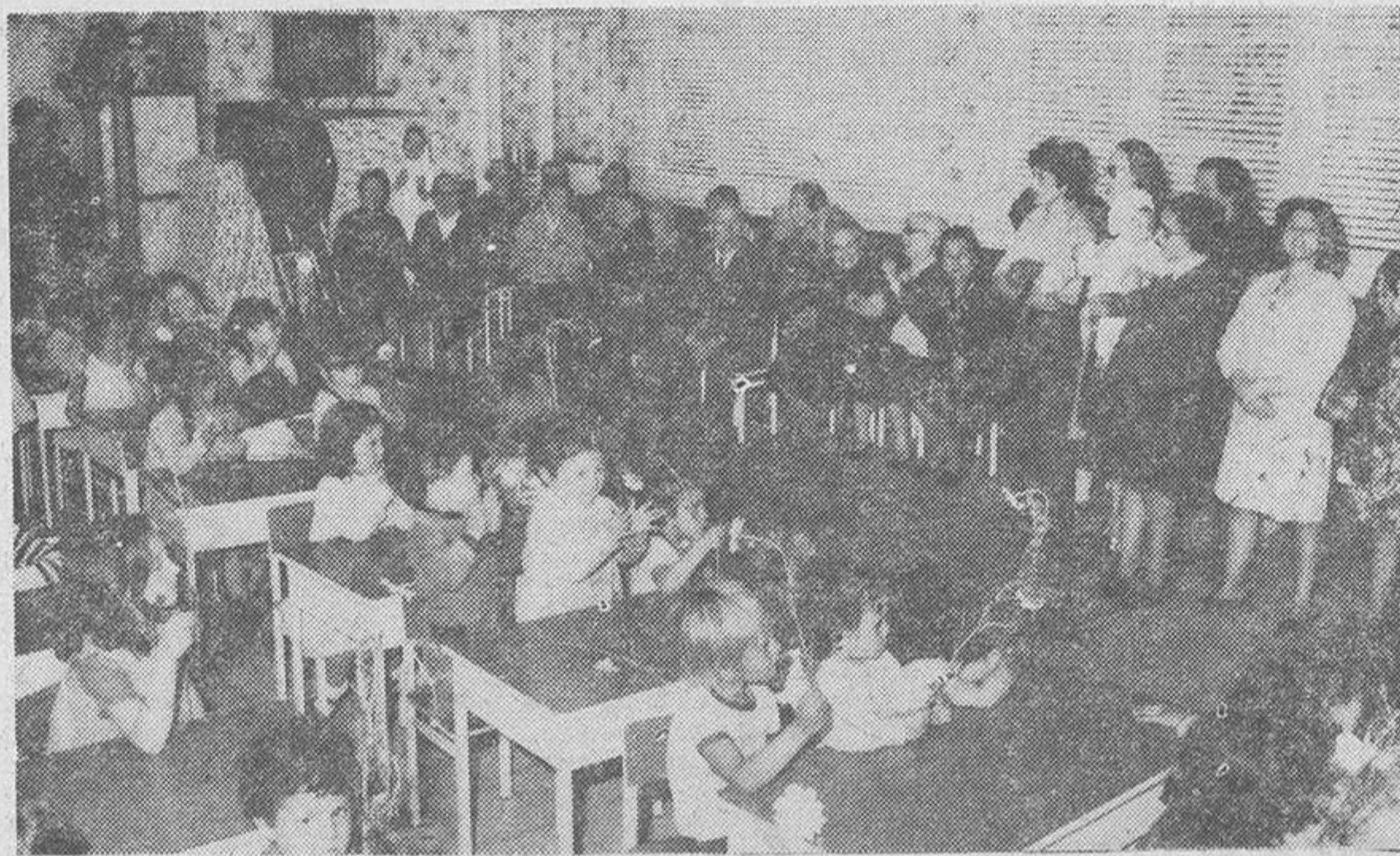
La guardería infantil del Patronato de la Caridad en el transcurso de una fiesta allí celebrada.