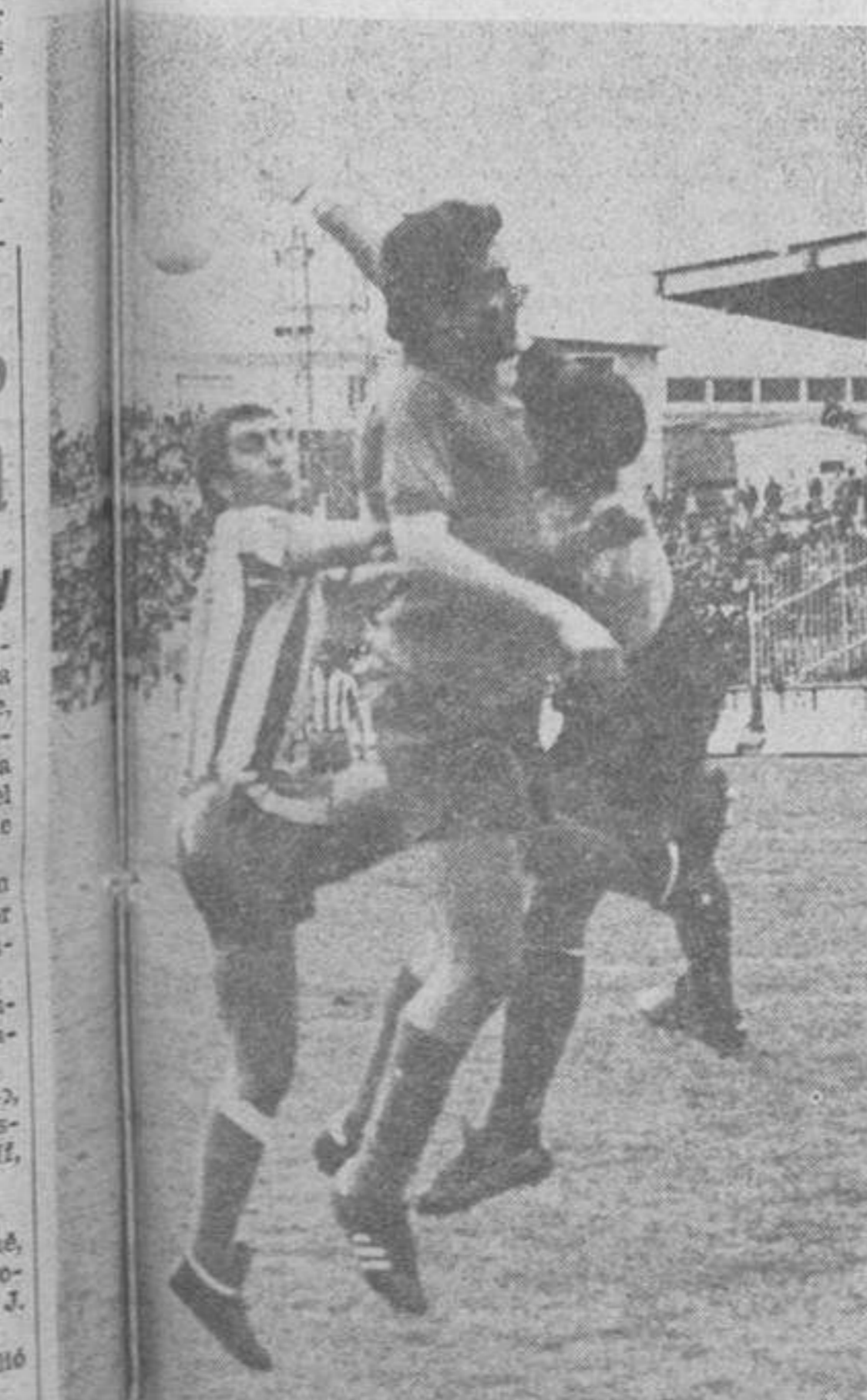
Un jugador del Deportivo saltando para despejar un balón en la portería, que intentaba rematar Pousada interceptado por un defensa visitante. (Foto Quián).

Aunque los jugadores del Deportivo iniciaron su partido de ayer frente al Getafe madrileño, en Riazor, con mayor decisión y velocidad, anticipándose a los rivales y imponiendo su ley, bastaron un par de errores, para que el público empezase a soliviantarse, y, como consecuencia, para que el conjunto blanquiazul se viese abajo. Y de ese modo, que es posible que, pese a ser la actual una de las temporadas más aclamadas de la historia de nuestro Real Club, no resulte fácil encontrar un partido en que el fútbol de los nuestros fuese de más baja calidad, más anodino, más carente de vibración y de fuerza, más falto de ideas y de reflejos. "Aquello" fue una tan auténtica "des-