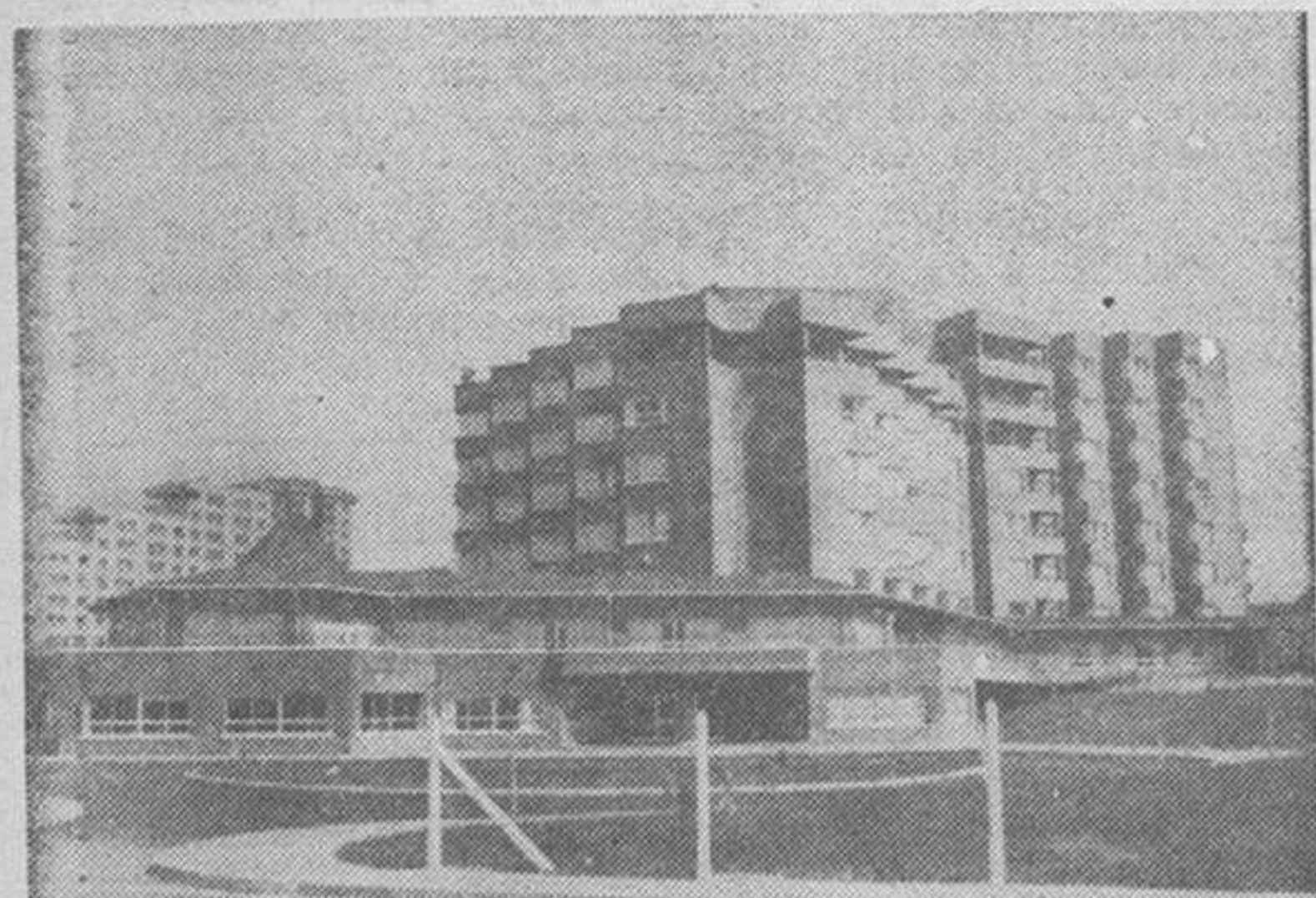
Residencia de pensionistas, en el Polígono de Caranza.

EL FERROL. — En esta ciudad funciona, desde hace escasos días, una Residencia de Pensionistas de la Seguridad Social. Quizá haya alcanzado este caso eco, por el momento, esta apreciable mejora local, porque el acto de apertura ha sido sencillo, sin grandes alardes; únicamente una sesión folklórica amenizó la primera jornada oficial de los también primeros pensionistas acogidos, solo treinta y tantos. Se dice que la Residencia está en período de rodaje, son optimistas los principios, pero no se sabe todavía su marcha en el futuro, que todos deseamos sea buena e indiscriminatoria. Que se ajuste a las necesidades de alojamiento por un orden estricto de prioridades ante quienes soliciten la estancia. De este nuevo logro ferrolano vamos a ofrecer hoy algunos datos.