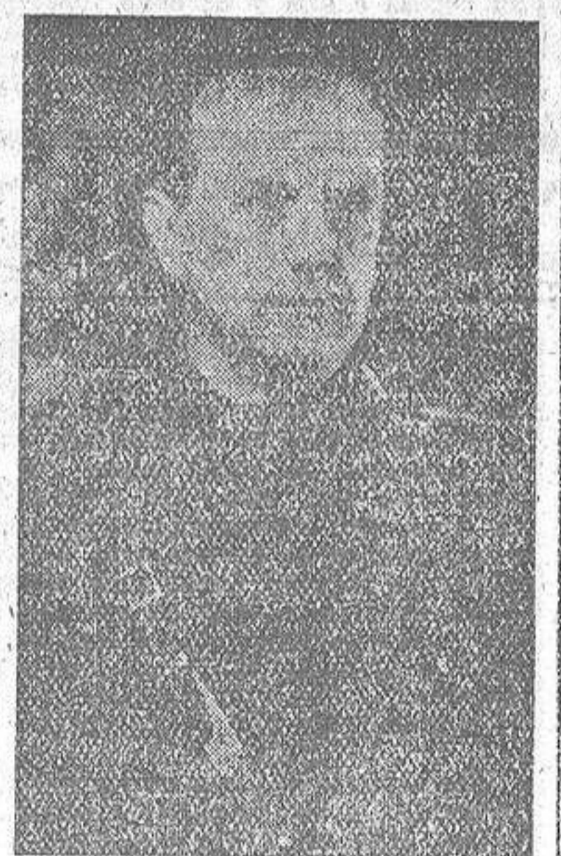
EL MINISTRO DE JUSTICIA DON RAIMUNDO FERNANDEZ CUESTA

También asistieron los Directores Generales de Justicia y Prisiones