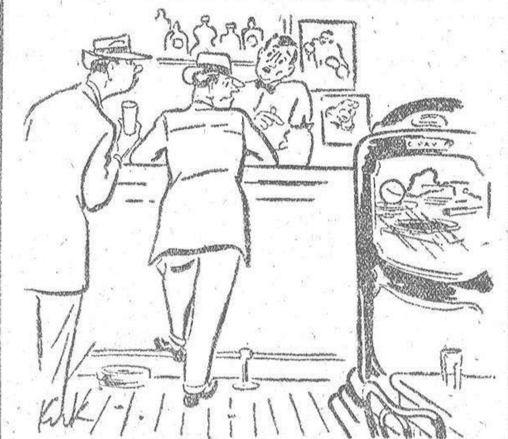
—Esa máquina es la última palabra de la música mecanizada. Si cada cinco minutos no se le echa una moneda, toca el "¡Mira que eres linda!"