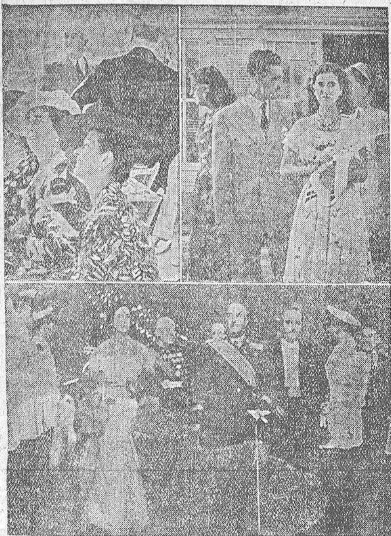
En las fotos superiores, el Caudillo y su esposa, con la señora del Caudillo General de la Región, presenciando las regatas. La hija del Generalísimo, que también asistió a los actos deportivos. — En la foto de abajo, el Jefe del Estado y su esposa, son recibidos por el Alcalde en el Palacio Municipal, donde se celebró la cena de gala.

UNA vez más La Coruña ha puesto de manifiesto el sincero cariño, respeto y gratitud que siente por su ilustre paisano, el Jefe del Estado español. Y el Generalísimo sabe corresponder a este afecto, poniéndose en contacto con el pueblo, para el que tiene la más franca de sus sonrisas y el más efectivo de sus ademanes.