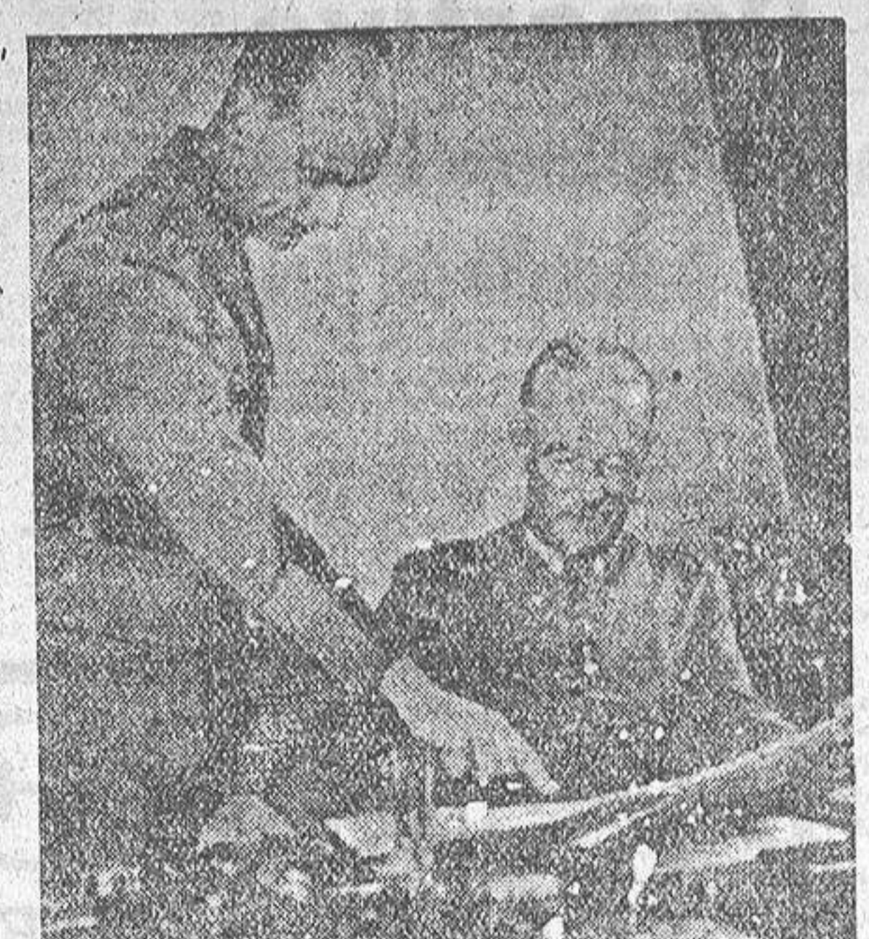
El general Henri Guisan (sentado), jefe supremo del ejército suizo durante la guerra, estudia el plano de las fortificaciones alpinas.

En embargo, hubo un hombre que prefirió luchar a entregarse. Fué el ge-