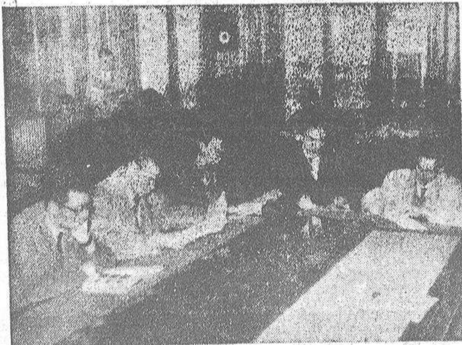
En la biblioteca del Circo de Artesanos siempre abundan los lectores, de lo que es buena muestra la fotografía.

SEÑORES COMERCIANTES E INDUSTRIALES Compramos los contratos de VENTAS A PLAZOS que celebréis, facilitando vuestro negocio S. E. COMERCIO Y CREDITO S. A.