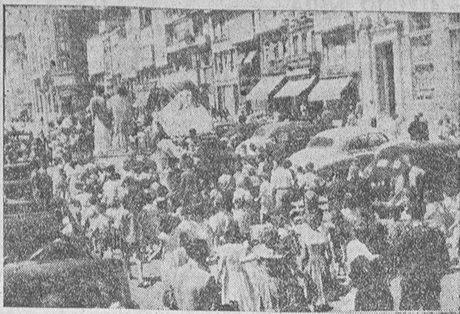
La grey infantil sigue, alborozada, las evoluciones de los gigantes y cabezudos