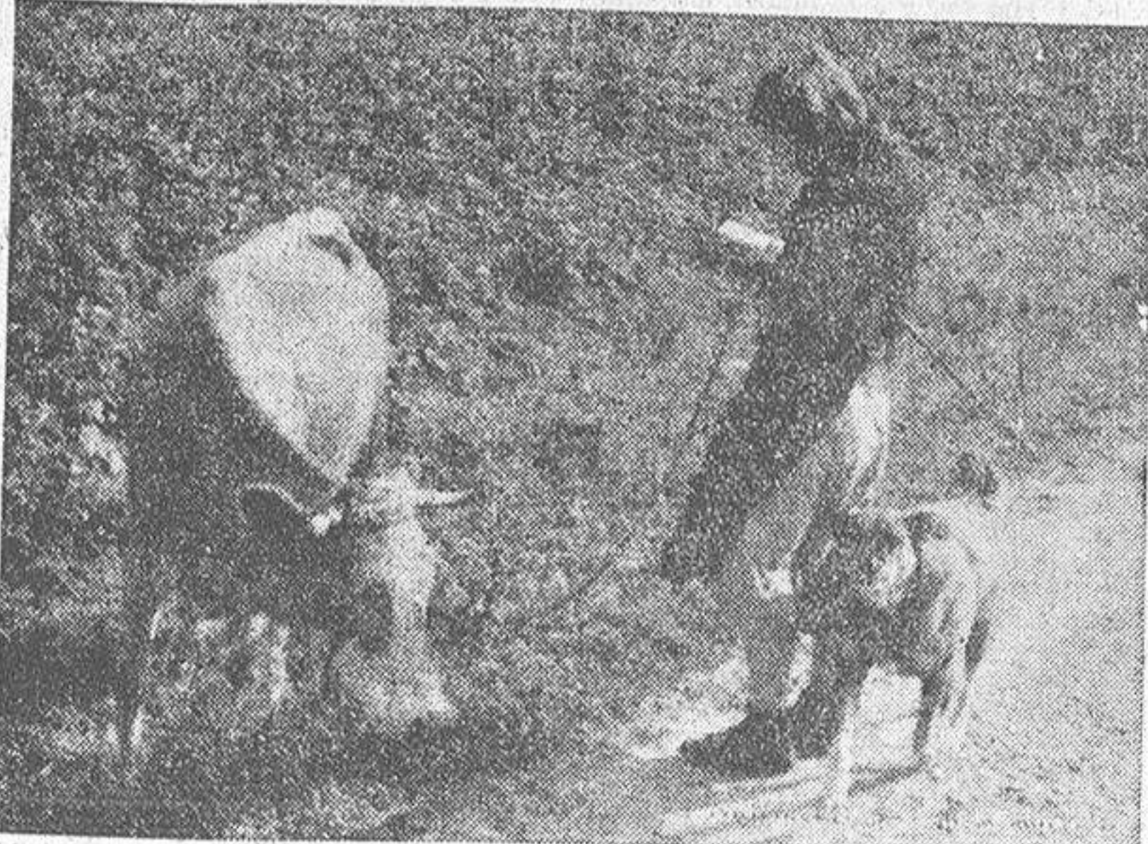
El perro venía hacia nosotros en actitud amenazadora. Un segundo de retraso en el disparo hubiera representado el verlo en pleno aire, aullando. Tranquila, novela en mano, la dueña...

Acabamos de dejar mujer, perro, novela y vaca, y nos encontramos frente a frente con el espantapájaros, muy cerca de la torre de Hércules. Guiando de no estropear el trigo, objeto de su vida, nos acercamos a él. La veleta se mueve y chirria, saludándonos. —¡Mucho trabajo?—preguntamos. —Regular. Esta es una época tranquila y no abundan los pájaros por