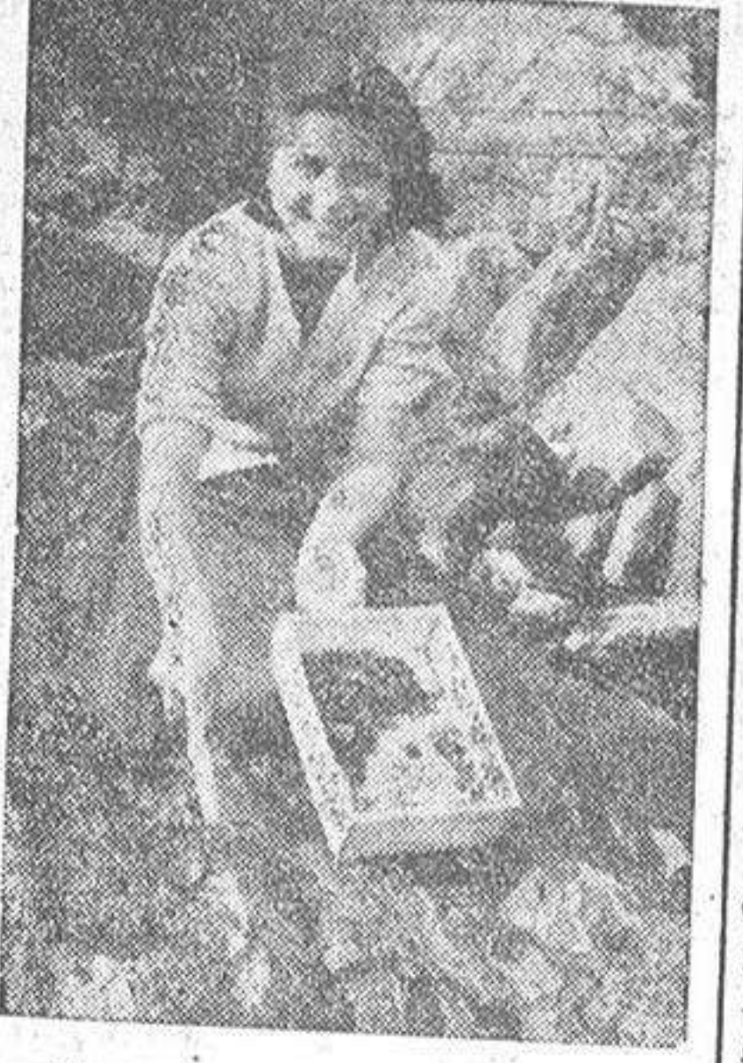
Con esta sonrisa no hay lapa que se resista

No se puede decir que existe playa en San Amaro, porque, si bien nunca fué muy buena, ahora ha desaparecido por completo ante la arrolladora fuerza de las máquinas de vapor, de las escavadoras, de todo ese artificio mecanizado que amenaza agotar la poesía de la vida. Cuando el zumbido de las máquinas se escucha, los que aman la naturaleza reciben un codazo, el aviso de que tienen que mudarse. Y se van a otro sitio, y tras ellos continúa siempre la máquina poderosa e indestructible. En fin, no divaguemos, sea nada más como un "descanso en paz" dedicado a la playa de San Amaro, lugar que fué donde las lanchas de pesca-