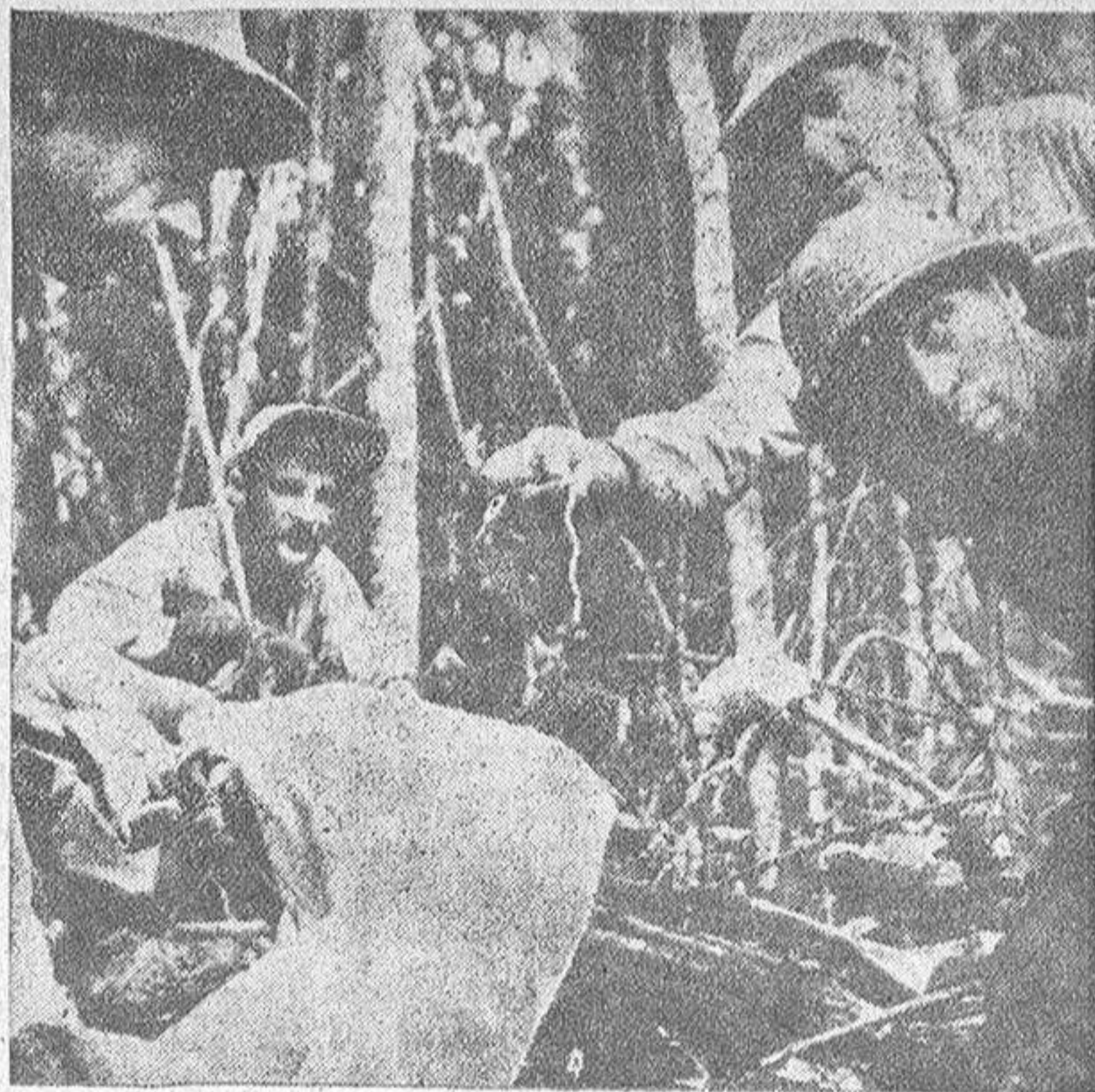
De entre los restos del avión destruido, fueron recogidos 200.000 dólares en un saco y varios collares de perlas, como el que muestra uno de los paracaidistas.

La lucha contra la maleza, los insectos y las enfermedades desfiguró a algunos de los hombres